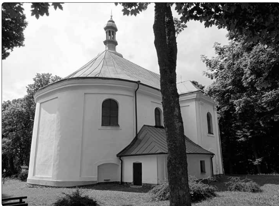
Kostel zasvěcený sv. Anně na Anenském vrchu (Annaberg)

Co se týče samotného poutního místa, od 70. let 20. století se zde datují zákazy poutí a také chátrání poutního kostela. Až po změně režimu vzrostl o místo zájem, dovršený jeho rekonstrukcí. Významným se pak stal především rok 2002,