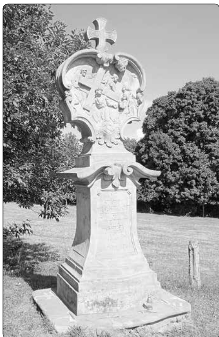
Křížová cesta v Rudě u Rýmařova

Ten kdysi spolu s jistým uničovským radním projížděl lesem k rudskému mlýnu. Koně se ale splášili a kočár, ve