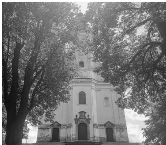
Kostel Panny Marie Pomocné na Uhlířském vrchu vysvěcený roku 1762