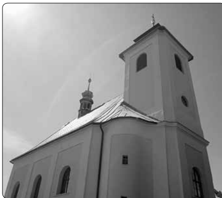
Kostel Panny Marie Sněžné v Rudě u Rýmařova

kterém oba muži cestovali, spadl do rokle. Neštěstí přežili, což přisuzovali moci Panny Marie. A z vděčnosti nechali v Rudě, na místě, kde se dříve rozkládala zahrada, postavit kostel.