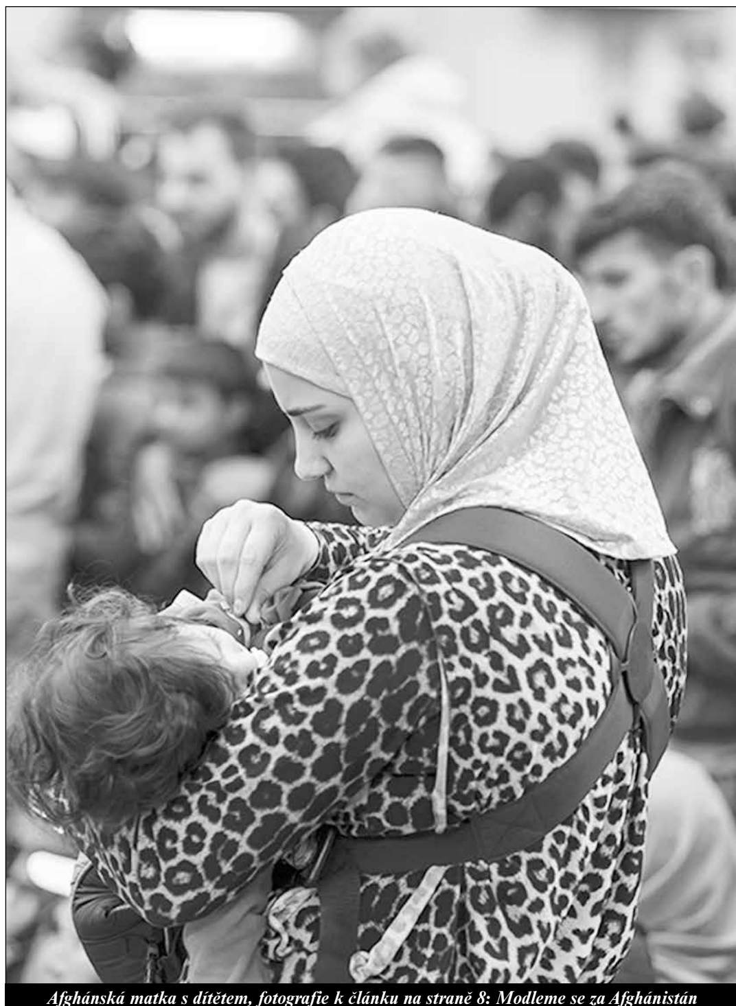
Afghánská matka s dítětem, fotografie k článku na straně 8: Modleme se za Afghánistán

Z dětí, které přežijí potrat, jsou ještě zaživa odebírány tkáně a žádané orgány - strana 12 -