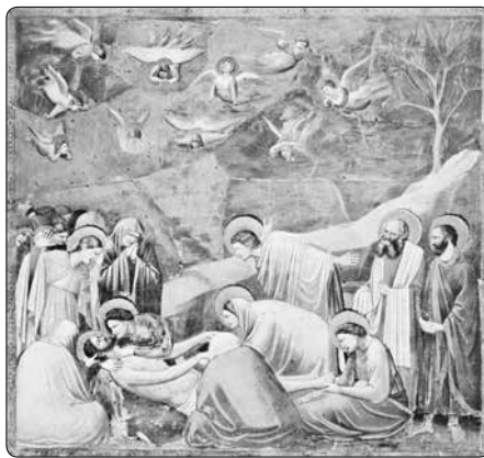
Giotto di Bondone (kolem 1267–1337) Oplakávání Krista, kaple Scrovegniů

Padovský kostel sv. Filipa a Jakuba vybudovali v 2. polovině 13. století při svém klášteře augustiniáni poustevníci, a proto si zachoval přídomek „agli Eremitani“, přestože od napoleonských dob přešel pod správu diecéze. Na seznam UNESCO se dostal díky freskovému cyklu od Guarienta z 60. let 14. století, na kterých jsou zachyceny příběhy titulárních světců a otce řádu, sv. Augustina. Inspiraci nedalekou Kaplí Scrovegniů nezapře volba mo-