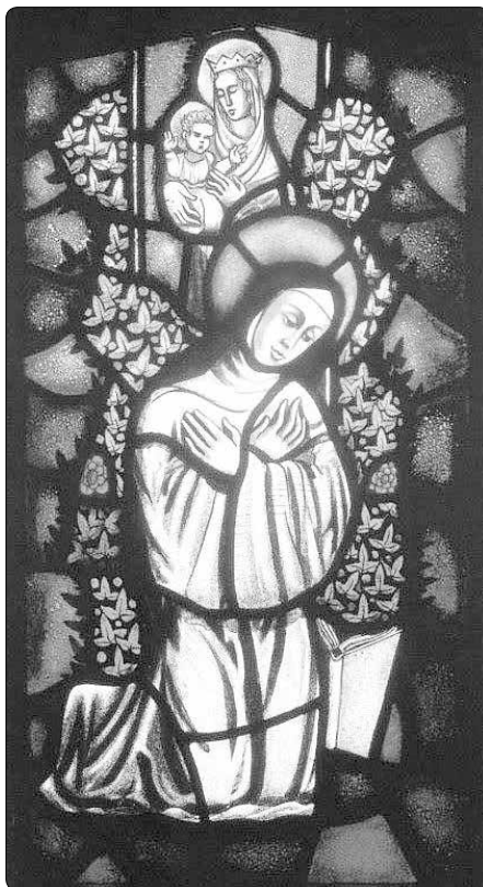
Blahoslavená Beatrice z Nazareta