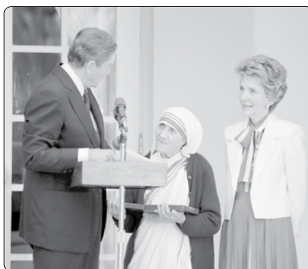
Prezident Ronald Reagan předává Matce Tereze Prezidentskou medaili svobody