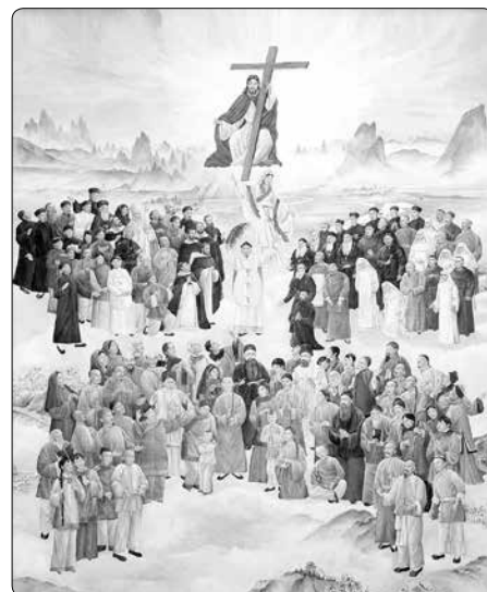
Svatý Augustin Zhao Rong a jeho druhové mučedníci

Soudce ale bezmála již osmdesátiletý Petr touto svou logikou nepřesvědčil. Vyměřil mu deset ran bambusovou holi a tvrdý žalář. Petr pro některé provokativně, pro jiné nepochopitelně za rozsudek