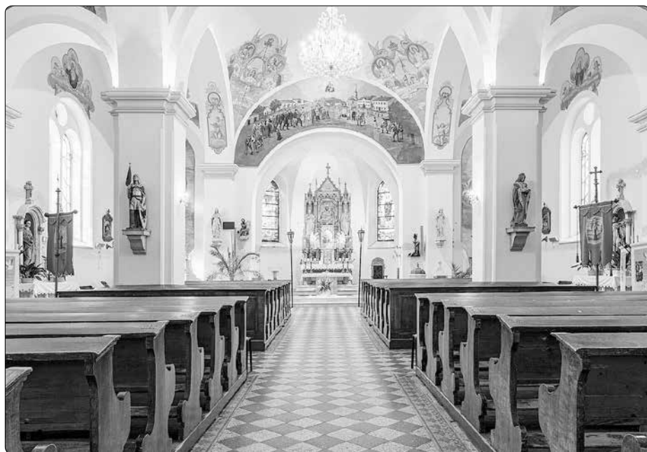
Interiér novorománského kostela Nanebevzetí Panny Marie v Hrabyni

„Dávno je tomu, tenkrát jsem býval hezounký hoch – po cestě jsem zpíval, korouhev napřed, za ruku otec vedl mne dolem a vedl mne horem, vedl mne po poli a vedl mne borem,