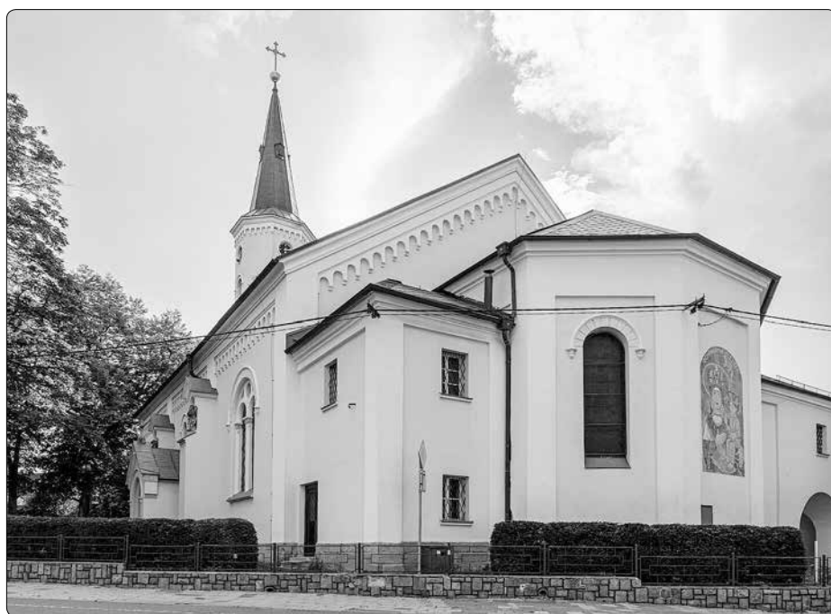
Novorománský kostel Nanebevzetí Panny Marie v Hrabyni

Drtivá většina z nich se datuje do 18. století. A začneme rokem 1722, kdy se do kostela vloupali zloději. Všechny cennosti naházeli do pytle, ovšem loupež nedokončili. Nikdo neví, co se odehrálo, ale druhý den zde byl nalezen ranec se všemi předměty. Nic se neztratilo, což lidé přičítali milostnému obrazu a jeho zázračné moci.