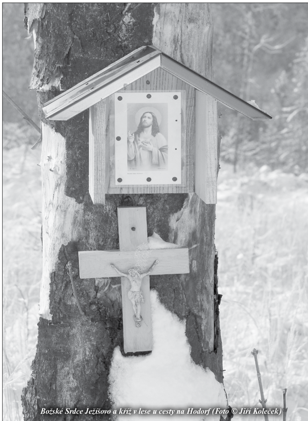
Božské Srdce Ježíšovo a kříž v lese u cesty na Hodorf