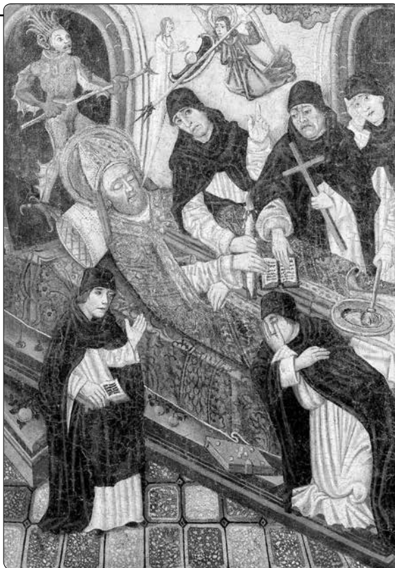
Anděl a ďábel bojují o duši umírajícího biskupa. Katalánská tempera, 15. století

Rovněž Ježíšova rozmluva s dobrým lotrem ukazuje na existenci nesmrtelné duše. Na prosbu: „Ježíši, vzpomeň si na mne, až přijdeš do svého království“ (Lk 23,42), Pán Ježíš odpovídá: „Vpravdě ti říkám, dnes budeš se mnou v ráji.“ (v. 43) Spasitel použil termínu „ráj“, který poukazuje na život po smrti, před zmrtvýchvstáním těl. Když Ježíš říká: „Dnes budeš se mnou v ráji“, potvrzuje zřetelně, že po smrti těla nesmrtelná lidská duše pokračuje ve své