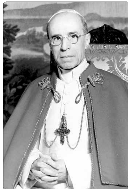
Papež Pius XII.

„Myslím, že všichni tak trochu tápali ve tmě – Angličané, Američané, Svatý stolec. Nicméně diplomaté, kteří pracovali v terénu, si vyměňovali informace, a to je také zajímavý prvek, který kniha potvrzuje. Když do vatikánských úřadů dorazily první důkazy o masovém vyhlazování, diplomaté ve Státním sekretariátu byli ohromeni, zara-