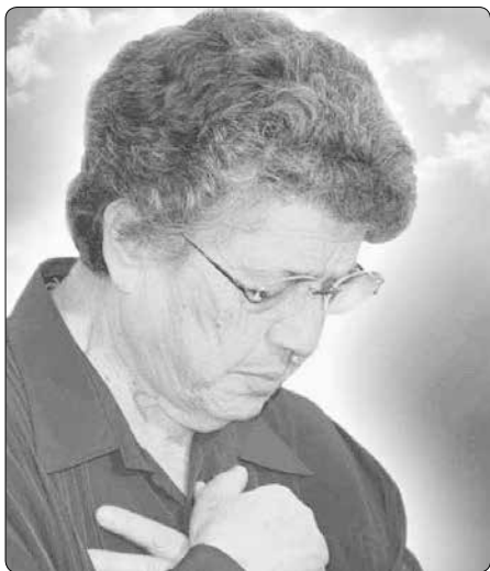
Natuzza Evolová (1924–2009)

Natuzza Evolová (1924–2009), známá italská stigmatizovaná mystička, měla výjimečné charisma kontaktu se zemřelými přebývajícími v nebi i v očištění, též s osobami zavrženými, které na důrazný příkaz Boha musely podávat svědectví o věčném trestu pekla.