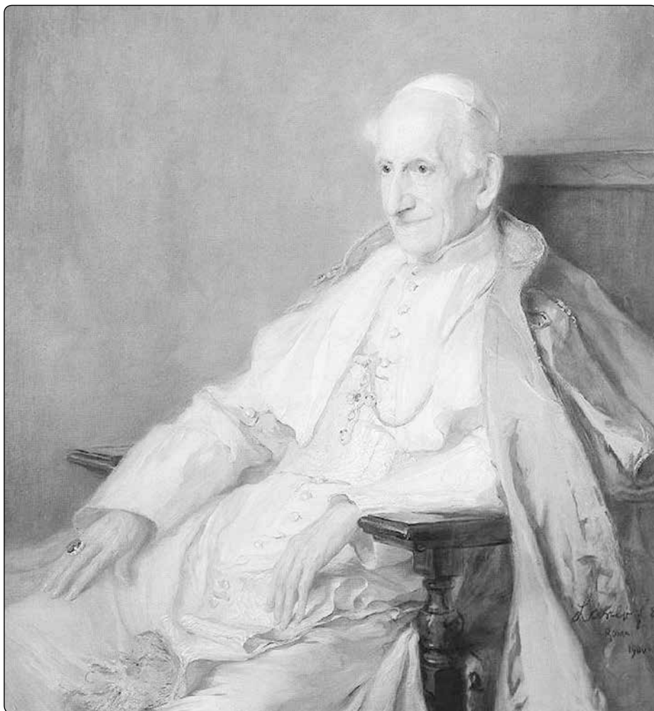
Lászlo Fülöp Elek: Poslední portrét Lva XIII. (1900)

LI. Kristus se skutečně pokořil a my, když máme pocit, že jsme pokořeni, vůbec se neponižujeme, nýbrž zaujímáme místo nám příslušné. On je Bůh, a přece se stal slabým člověkem, chtěl být mužem bolesti. Moudrost nesla pohanu blázna,