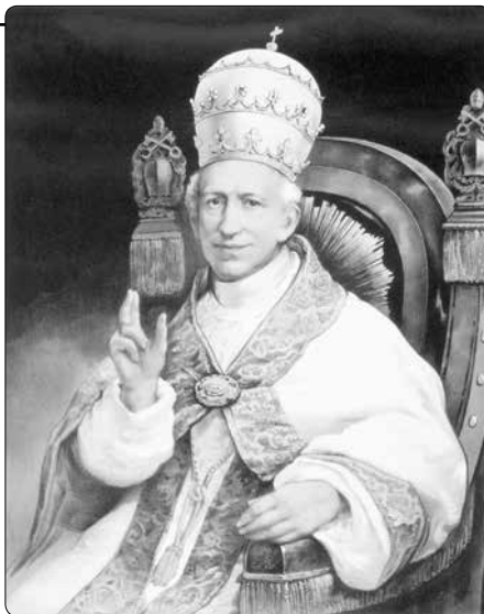
Lev XIII. (1810-1903)

XXX. Snad jsi od Boha dostal veliké nadání? Jsi vážen pro nějaký veliký čin?