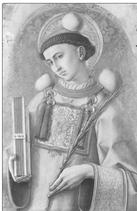
Carlo Crivelli (asi 1495): Sv. Štěpán v jáhenské dalmatice s atributy mučedníka - palmovou ratoleští a kameny

a) První je, aby odměnil již v tomto životě prokázané služby, které pro něho vy-