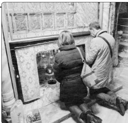
Místo Ježíšova narození, bazilika Narození Páně v Betlémě

Od samého počátku Kristem založené společenství Církve je nejvíce pronásledovanou náboženskou skupinou na světě. Nedá se rozumně vysvětlit, proč jsou lidé nenávidící Krista a ty, kteří v něho věří. Nepochopitelné je, proč odmítají křesťanský systém hodnot opírající se o lásku, odpuštění, svobodu svědomí a úctu k důstojnosti každé lidské osoby. Každodenně