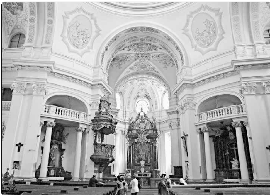
Pohled do interiéru baziliky sv. Vavřince a sv. Zdislavy v Jablonném v Podještědí

A právě slovo rodina bychom měli mít při návštěvě Jablonného na paměti. A vlastně nejen při ní, ale i po celý život, speciálně v tento vánoční čas, kdy se setkáváme u slavnostního stolu. A speciálně v této společnosti, ve které rozvodovost trhá rekordy a rok od roku spolu vydrží méně a méně manželství, která porazí i sebeslabší záchvěv krize. Aniž by pamatovala na Písmo svaté a slova: „Takto už to nejsou dva, ale jediné tělo. Nuže, co Bůh spojil, člověk nerozlučuje.“ Nebo na slova papeže Fran-