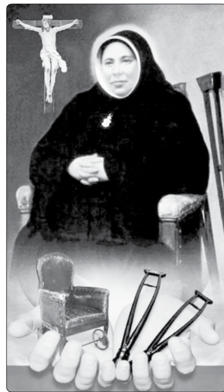
Svatá Jenovéfa Torres Morales

tivá. Své bolesti obětovala Bohu za obrácení hříšníků. Zhruba po dvou letech našla útočiště u valencijských karmelitek, přesněji v sirotčinci jimi vedeném. Setrvala v něm devět let.