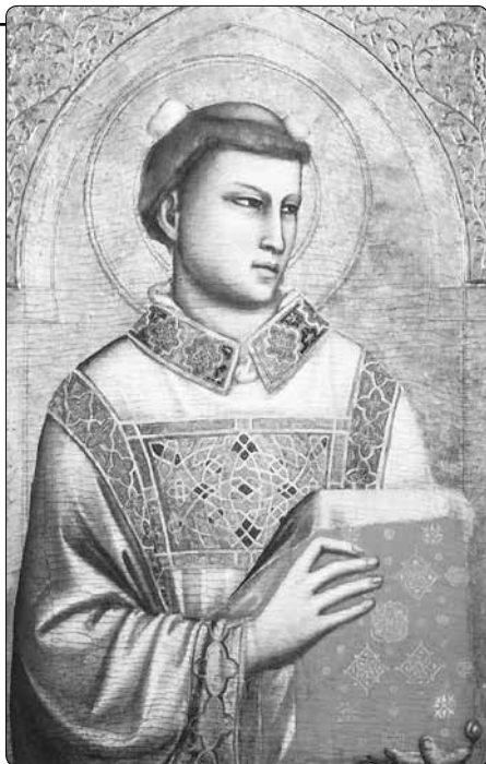
Giotto di Bondone († 1337): Sv. Štěpán

3. Zde budu rozjímat nad tím, proč se sv. Štěpán nejdříve modlil za sebe a odevzdal svého ducha našemu Pánu, a pak za své nepřátele; zatímco náš Pán Kristus tak učinil naopak, tedy nejdříve se modlil za své nepřátele a pak, když byl připraven, odevzdal svého ducha Otcí. Důvodem bylo to, že modlitba má začínat tím, co je nejdůležitější a je povinností, zvláště když je to v čase velkého soužení a trýzně. A protože náš Pán Kristus se nemusel modlit za sebe, ale za všechny hříšníky a zejména za ty, kteří ho ukřižovali, naléhavě se tedy modlil za nás, abychom se neponořili do hlubin pekla; proto se z lásky modlil nejdříve za své nepřátele;