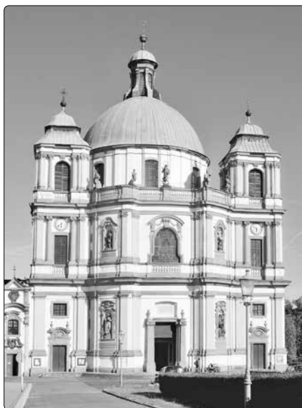
Bazilika sv. Vavřince a sv. Zdislavy v Jablonném v Podještědí

Ale i na sebevětších troskách může vzniknout něco krásného.