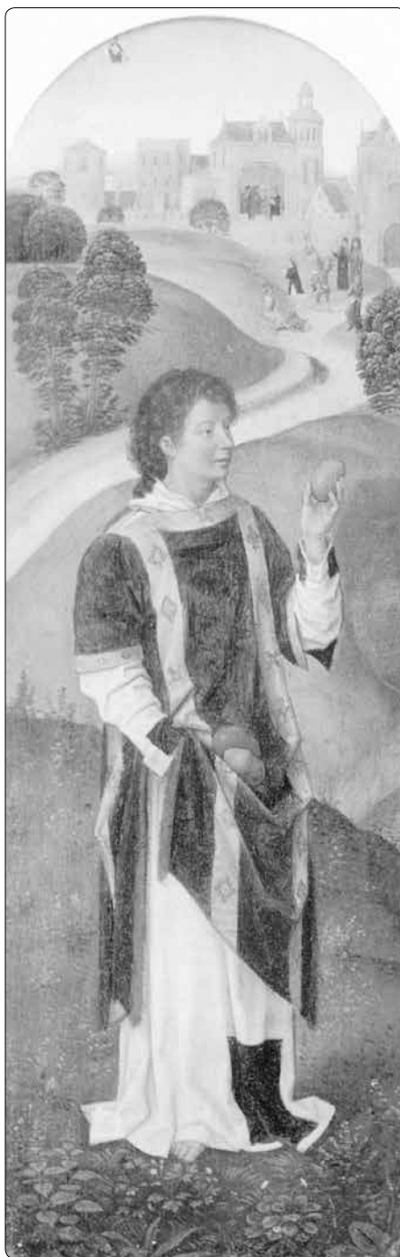
Hans Memling (kolem 1433–1494): Svatý Štěpán

omezena. Poprosím tohoto světce také o přimluvu za mě u Boha; neboť jestliže jeho modlitbou získal ještě větší dary pro Saula (Šavla), který pronásledoval Ježíše Krista, může je vyprosit i pro mě; a ten, který mohl vykonat tak mno-