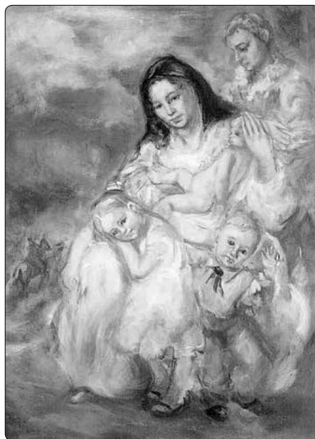
Svatá Zdislava z Lemberka

A právě jí je připisována chvála za to, že umírajícímu se začaly vracet životní funkce a ještě toho dne otevřel oči a pohnul hlavou. Dalšího dne se mu také vrátilo plné vědomí a bez následků se uzdravil.