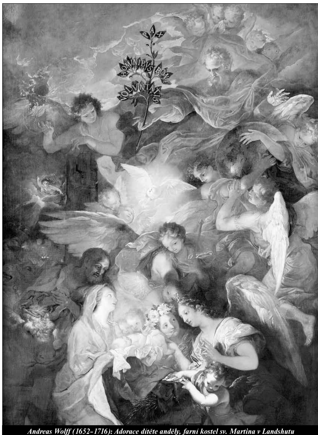
Andreas Wolff (1652-1716): Adorace dítěte anděly, farní kostel sv. Martina v Landshutu