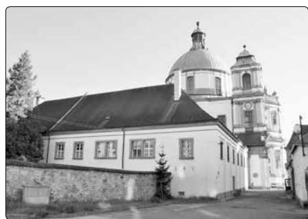
Bazilika sv. Vavřince a sv. Zdislavy s přilehlým klášterem

Další známá historie nás přenáší nejprve o necelých dvě stě let dále, do období husitských válek. Roku 1425 bylo Jablonné vypáleno, klášter a kostel poničen a dominikáni byli nuceni odejít.