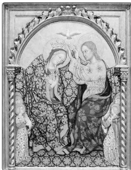
Gentile da Fabriano (kolem 1370-1427): Koronovace Panny Marie

Vládnout - to je úsilí velkých duší, podnět ke statečným dílům. Avšak existují dva