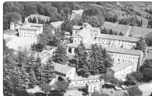
Trapistické opatství Casamari

lí sv. Benedikta a brzy se stal opatovým teologickým poradcem, převorem a novicmistrem. Když opat Ballandani v roce 1788 zemřel, kdy již končila velká vlna omezení a rušení klášterů v Toskánsku a v dalších habsburských územích, otec