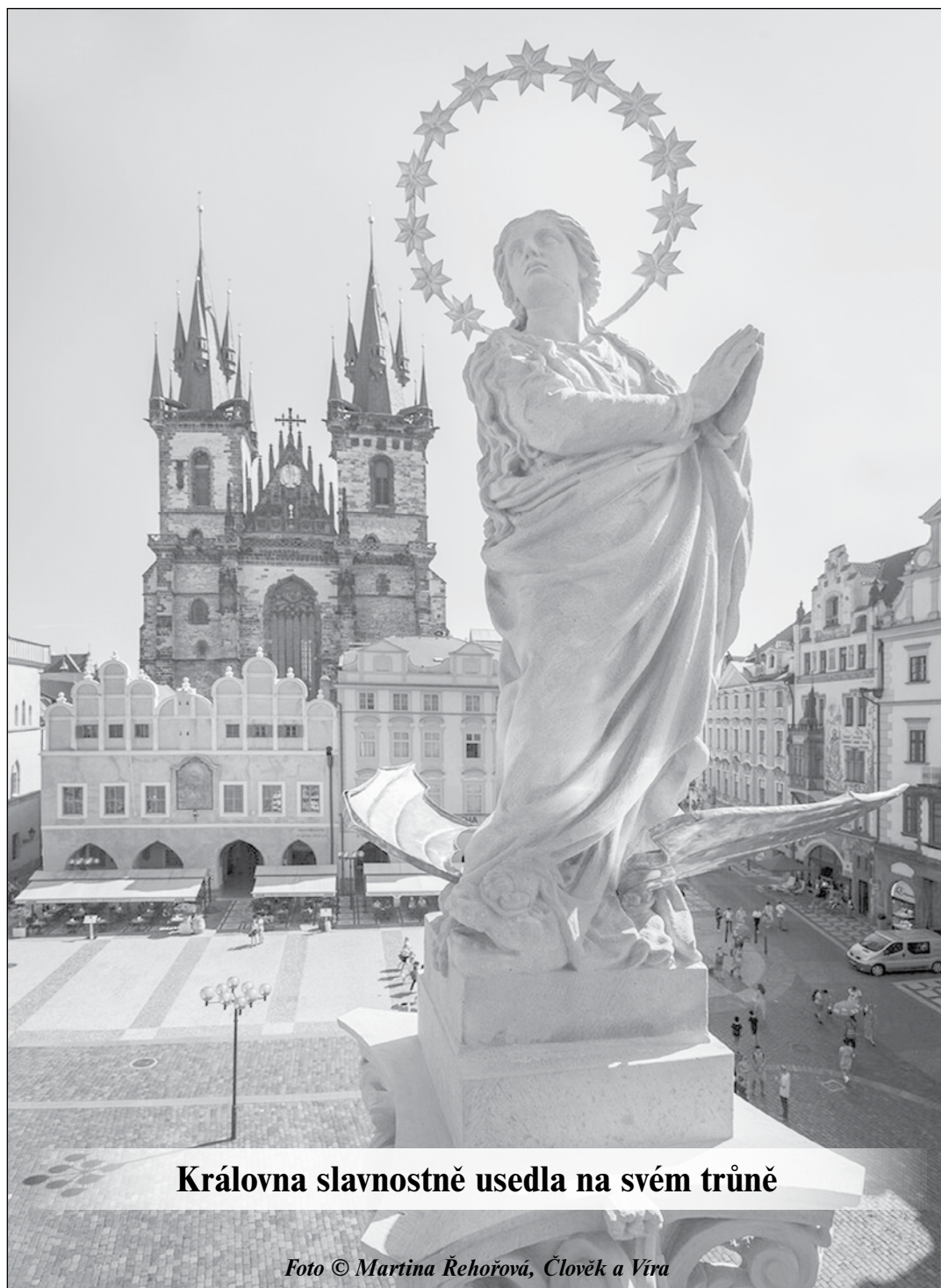
Královna slavnostně usedla na svém trůně