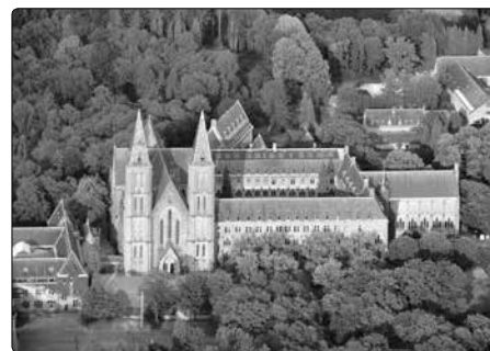
Opatství v Maredousu

osob. Otvíral je pro Boží lásku a milosrdenství, neopomíjel jim často připomenout i Boží spravedlnost, jež je nedílnou součástí Boží podstaty, na což se zejména dnes rádo zapomíná.