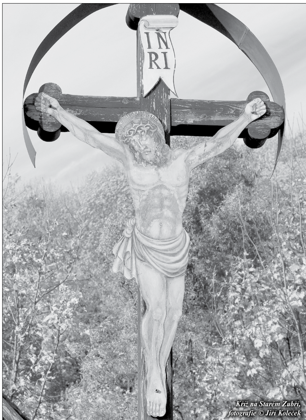
Kříž na Starém Zubří

Křížová hora - Bůh v lidských srdcích Petr Bobek - strana 10 -