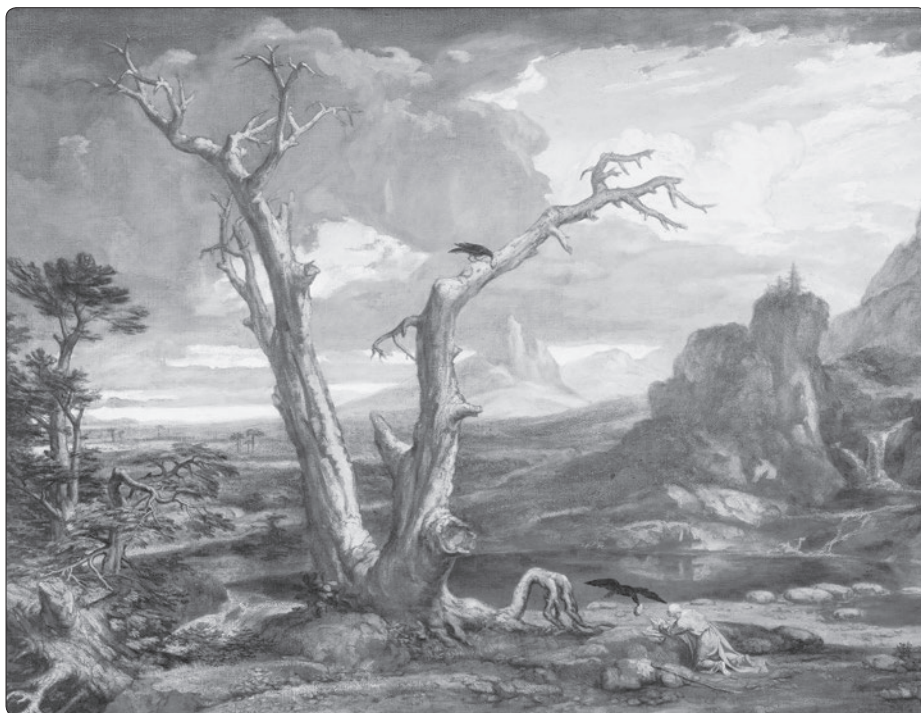
Washington Allston (1779-1843): Eliáš v poušti

Pak odešel ke králi Achabovi, jemuž předložil návrh, aby na hoře Karmel přinesli oběť jeho pohanští kněží pohanskému bůžku Baalovi a on přinese oběť svému pravému Bohu. Ani on, ani pohanští kněží nesmějí použít oheň k zapálení své oběti. Budou prosit ty, kterým přinesou oběť, aby oni sami ji zapálili. Pravým Bohem bude ten, který si svoji oběť zapálí. Lidu, který byl již velmi unavený a znechucený suchem a hladem, se tento návrh velice zalíbil. Achab jej nerad přijímal, ale pod nátlakem lidu jej přijmout musel. Lid se shromáždil na hoře Karmel. Pohanští kněží připravili svoji oběť a začali se modlit k Baalovi, aby oběť podpálil. To se nestalo. Eliáš svoji oběť nechal třikrát polít vodou tak, že všechno bylo mokré. Také strouha, kterou dal vykopat kolem svého oltáře, byla naplněna vodou. Tehdy se Eliáš modlil: „ Hospodine, Bože Abrahámův, Izákův a Izraelův, ať se dnes pozná, že jsi Bůh v Izraeli, že já jsem tvůj služebník a že jsem všechny tyto věci vykonal na tvůj příkaz. Odpověz mi, Hospodine, odpověz mi, aby ten lid poznal, že ty, Hospodine, jsi Bůh a že ty obračíš jejich srdce! “ A spadl oheň od Hospodina a strávil celopal