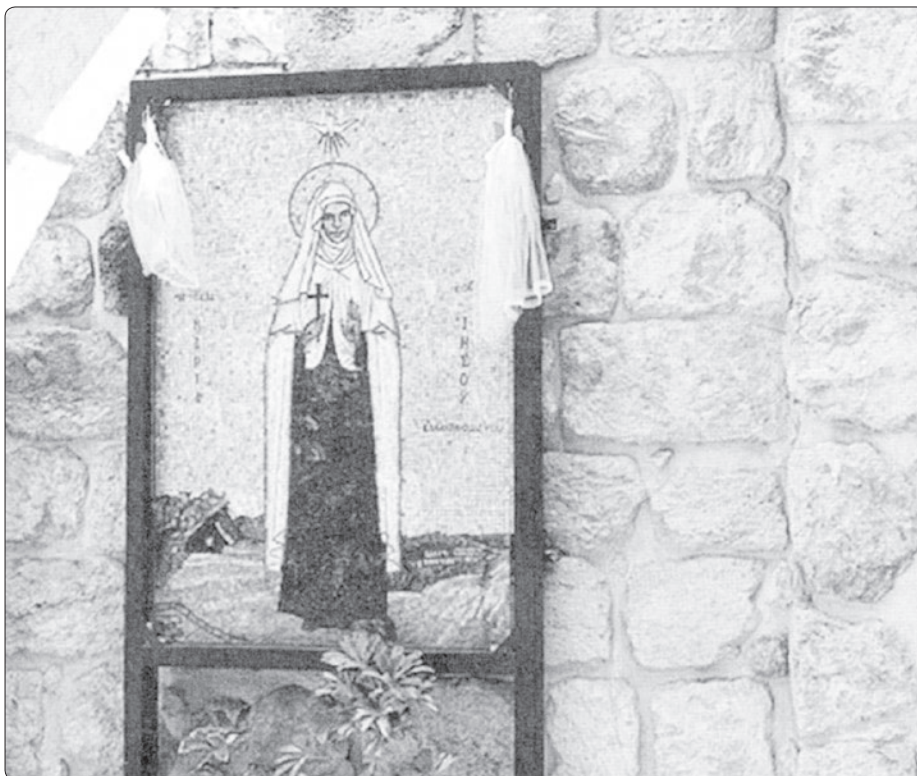
Rodný dům Mariam Baouardy v Abellinu s ikonou svaté přímlyvkyně