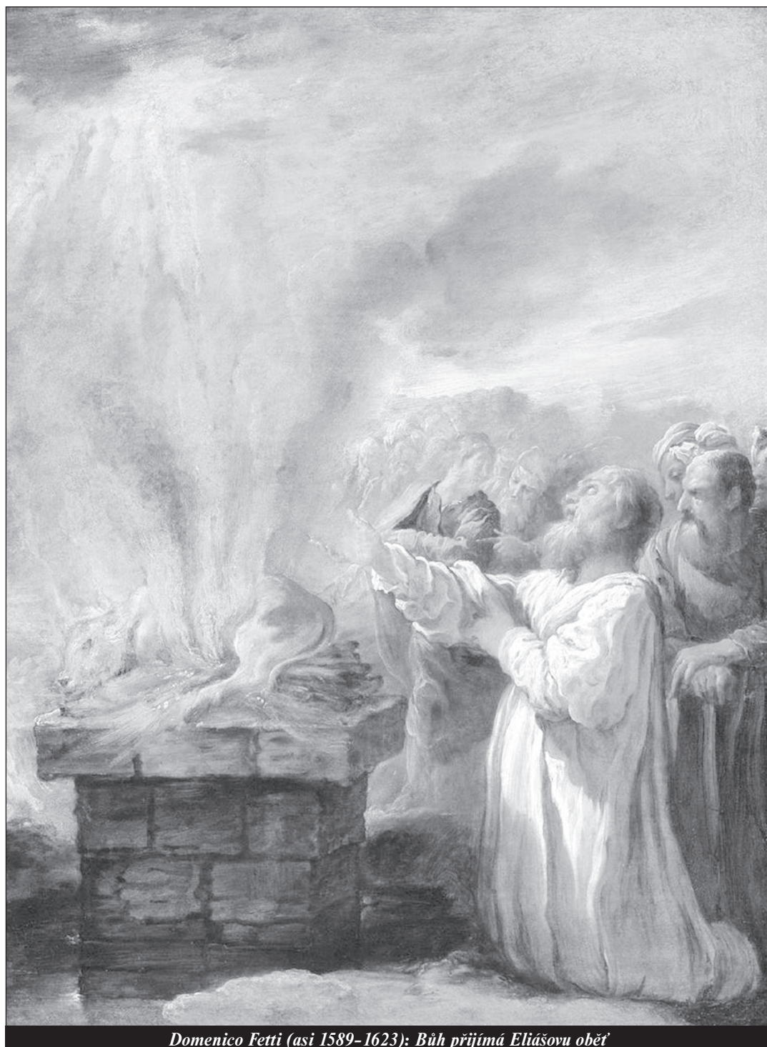
Domenico Fetti (asi 1589-1623): Bůh přijímá Eliášovu oběť