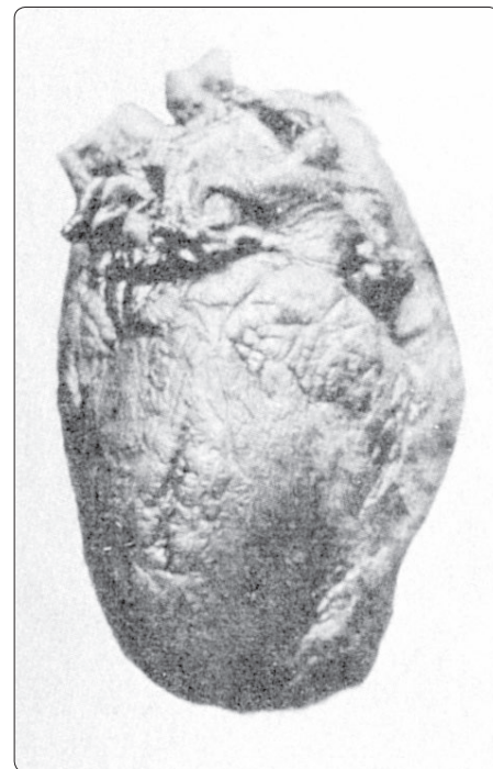
Probodené Mariamino srdce