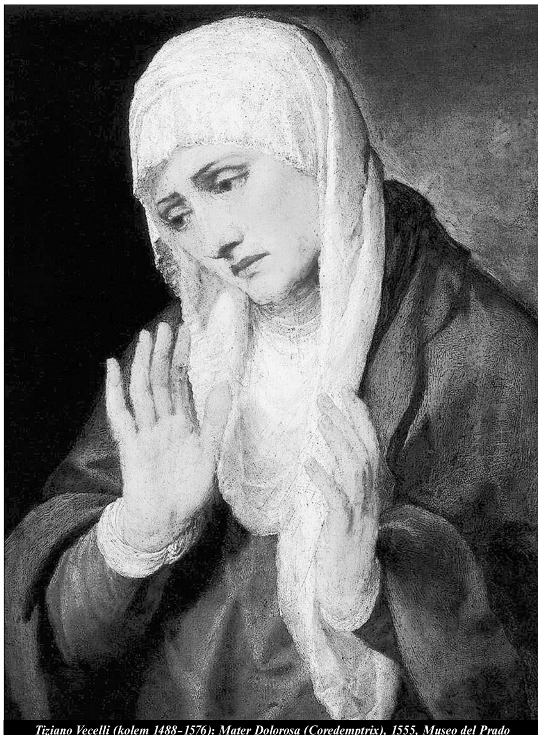
Tiziano Vecelli (kolem 1488-1576): Mater Dolorosa (Coredemptrix), 1555, Museo del Prado