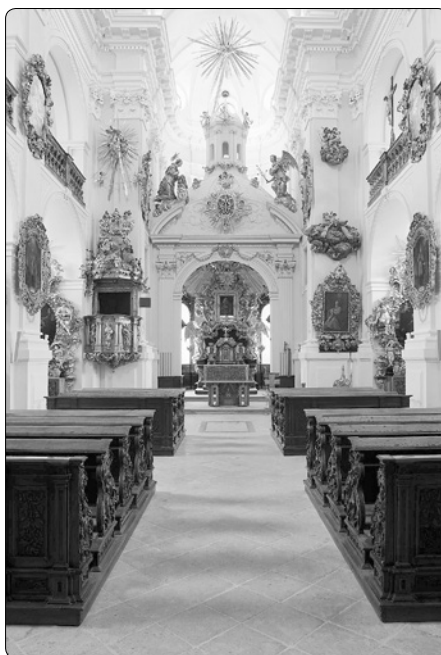
Interiér opraveného kostela