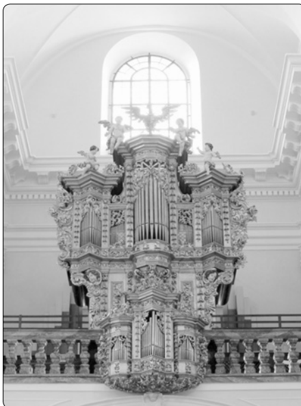
Unikátní zlacené varhany z roku 1714

Jak bylo řečeno, chrám obklopuje terasový ambít, zahrnující celkem osm kaplí. V těch rohových se nachází fresky patrně z roku 1750, které se tematicky věnu-