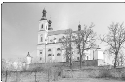
Luže je jedním z nejnavštěvovanějších míst královéhradecké diecéze