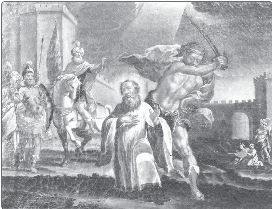
Mučednická smrt sv. Eulogia z Córdoba