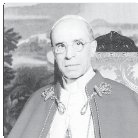
Papež Pius XII.