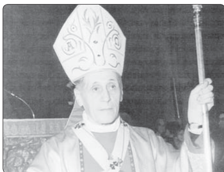
Kardinál Ernesto Ruffini