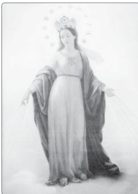
Panna Maria zázraku

Z Vítězstvo Srdca 132/2020 přeložila a upravila -jk-