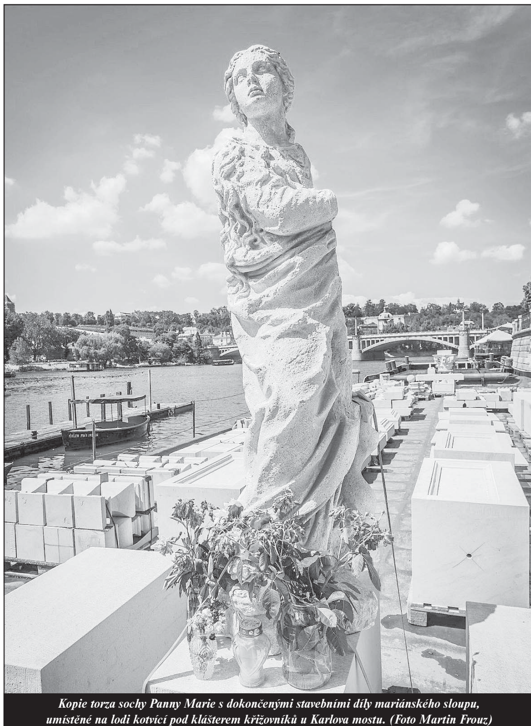
Kopie torza sochy Panny Marie s dokončenými stavebními díly mariánského sloupu, umístěné na lodi kotvíci pod klášterem křižovníků u Karlova mostu.