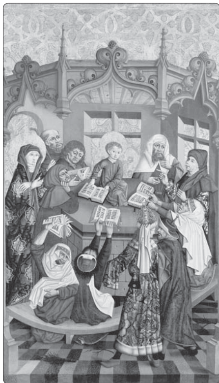
Dvanáctiletý Ježíš v chrámu, pozdně gotický obraz v Moravské galerii namalovaný temperou na panelu mezi roky 1460 a 1500

• Je svobodná a projevuje svoji svobodu tím, že se při zvěstování rozhodne pro