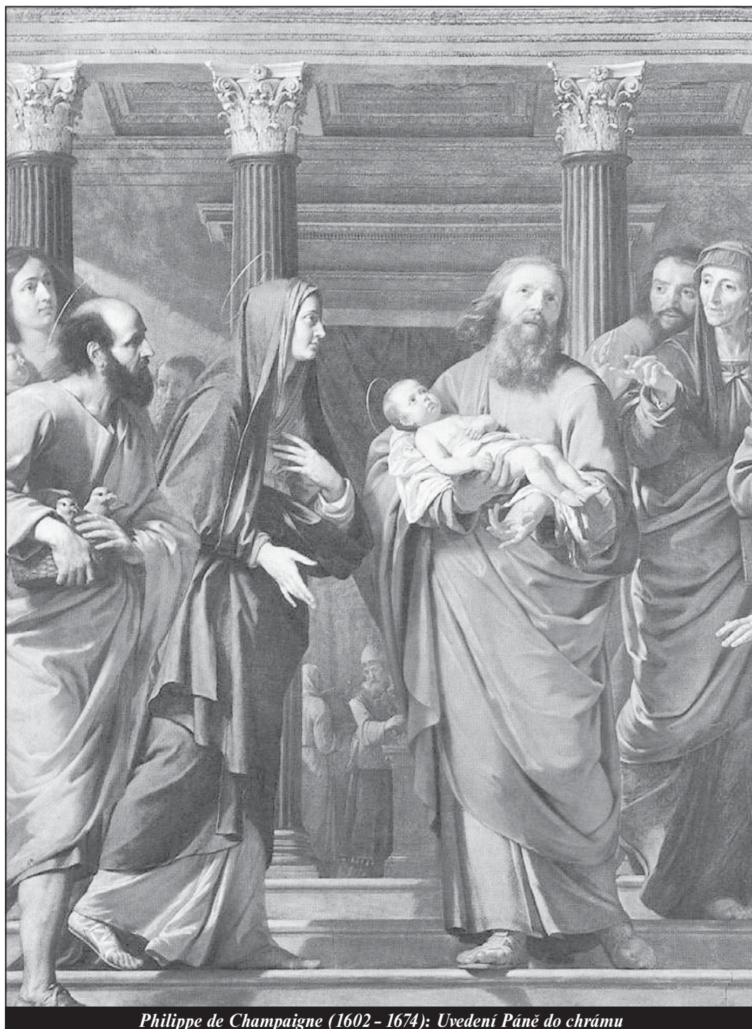
Philippe de Champaigne (1602 - 1674): Uvedení Páně do chrámu

Nemlčte k vraždění nigerijských křesťanů, naléhá tamní kněz - strana 13 -