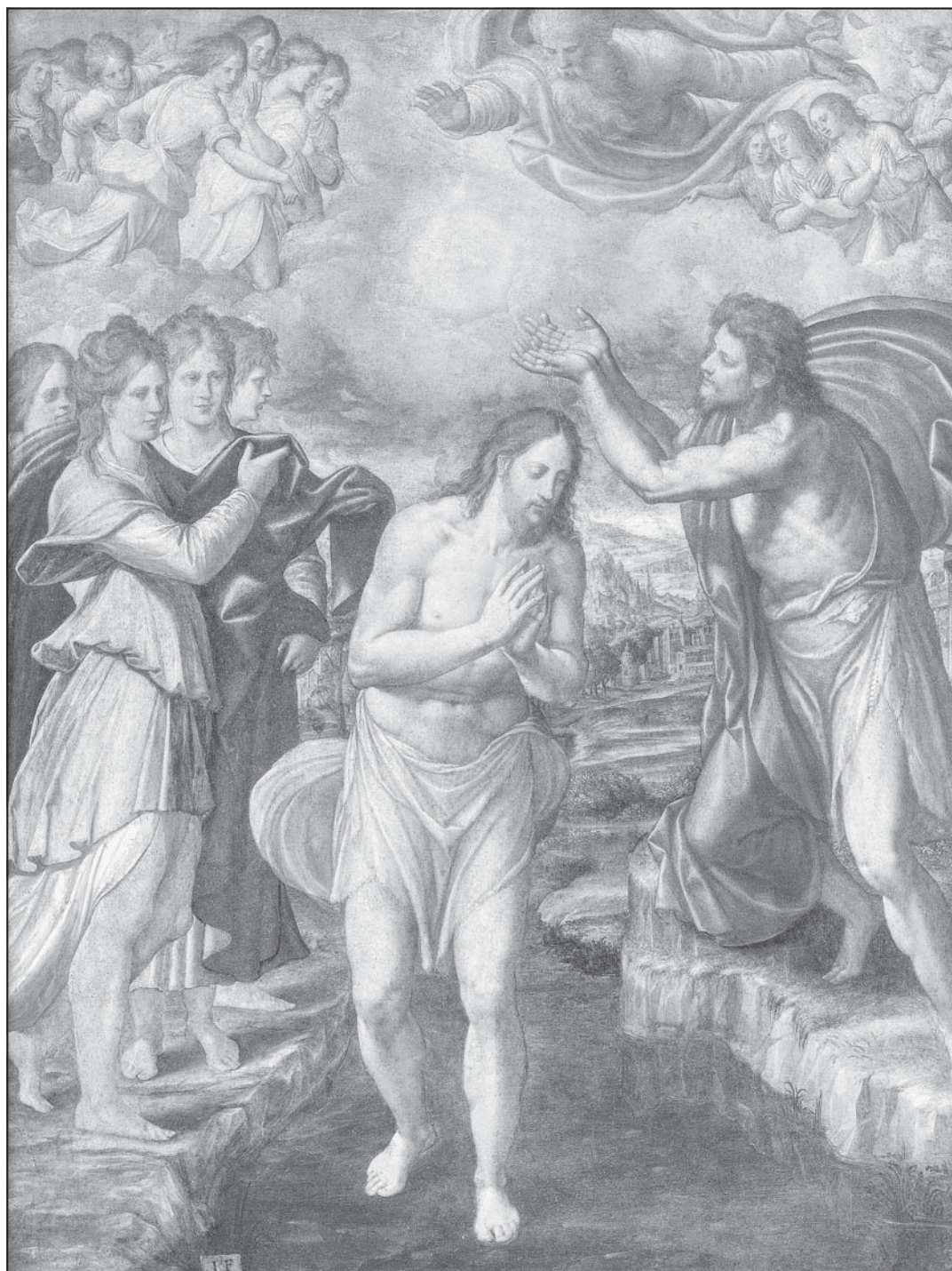
Juan Fernández Navarrete (kolem 1538-1579): Křest Páně, Museo del Prado, 1567

Palladium bude trvale vystaveno v bazilice Nanebevzetí Panny Marie ve Staré Boleslavi - strana 13 -