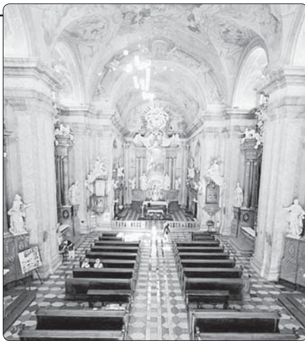
Interiér kostela Narození Panny Marie

Nepíše se, o jaké onemocnění šlo konkrétně. Nicméně Vranov si do své historie může zapsat i vyléčení z rakoviny prsu, z malomocenství nebo návraty řeči. Případ z roku 1704 také (byť jej můžeme