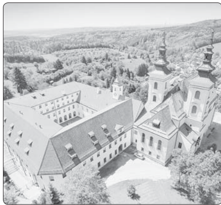
Vranov u Brna, rozsáhlý areál paulánského kláštera s kostelem Narození Panny Marie

Přesná podoba dřevěného kostela, který byl na Vranově postaven, není známa. Ví se jen rok, kdy zanikl, a sice 1622. Pro zjevné působení času a chatrný stav byl