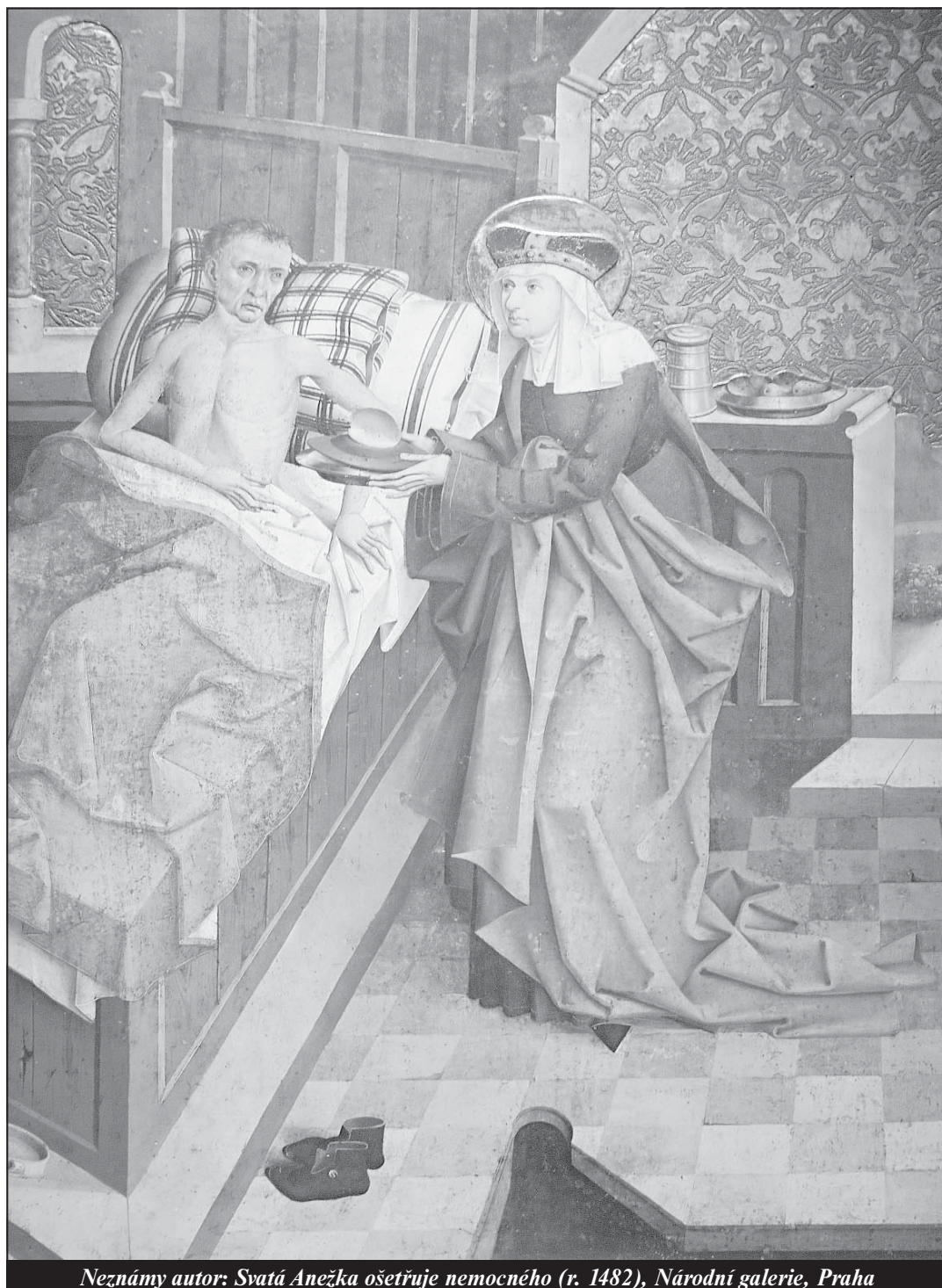
Neznámý autor: Svatá Anežka ošetřuje nemocného (r. 1482), Národní galerie, Praha

Statistika světové katolické církve za rok 2017 - strana 13 -