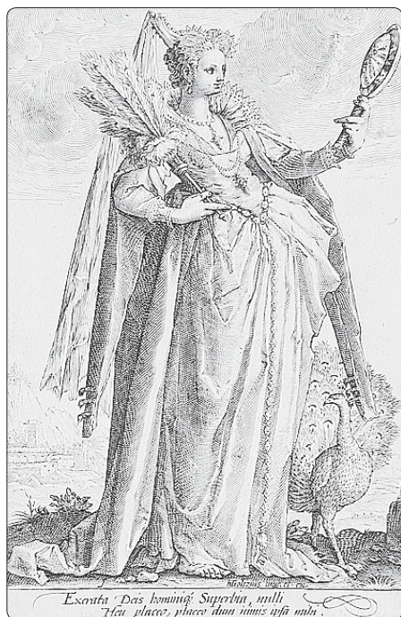
Jacob Matham (1571-1631): Pýcha

Na tomto příkladu pěkně vidíme velkou a radostnou pravdu pro nás všechny, že Ježíš nechce budovat svoje království jen z nevinných, ale i z hříšníků, kteří činí pokání. Vždyť on nám sám řekl, že přišel kvůli hříšníkům: „Lékaře nepotřebují zdraví, ale nemocní. Nepřišel jsem povolovat spravedlivé, ale hříšníky.“ (Mk 2,17) Ježíš přišel, aby nás osvobodil od hříchu, a to osvobození potřebují právě hříšníci. Čím je člověk větším hříšníkem, tím více potřebuje Ježíšovo osvobození. V nebeském království je místo