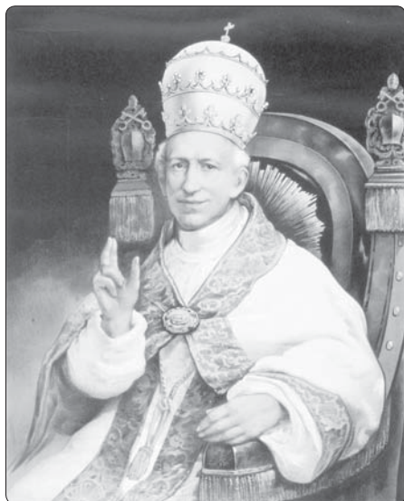
Papež Lev XIII.

Tato oddanost vznešené Královně nebes, tak velká a plná důvěry, nikdy nezářila takovým leskem jako tehdy, když bojující Boží církve ohrožovalo nebezpečí šířícího se násilím, kacířství, nepřipustný úpadek mravů, či útoky mocných nepřátel.