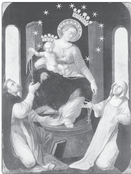
Obraz Matky Boží Růžencové z Pompejí

jsem, že přišel čas, abych svěřila všechno Matce Boží, protože jenom Ona mi může vyprosít milost zdraví. Ze začátku jsem měla při modlitbě novény potíže, ale postupně začaly mizet. Už během modliteb jsem se začala cítit lépe, a když jsem skon-