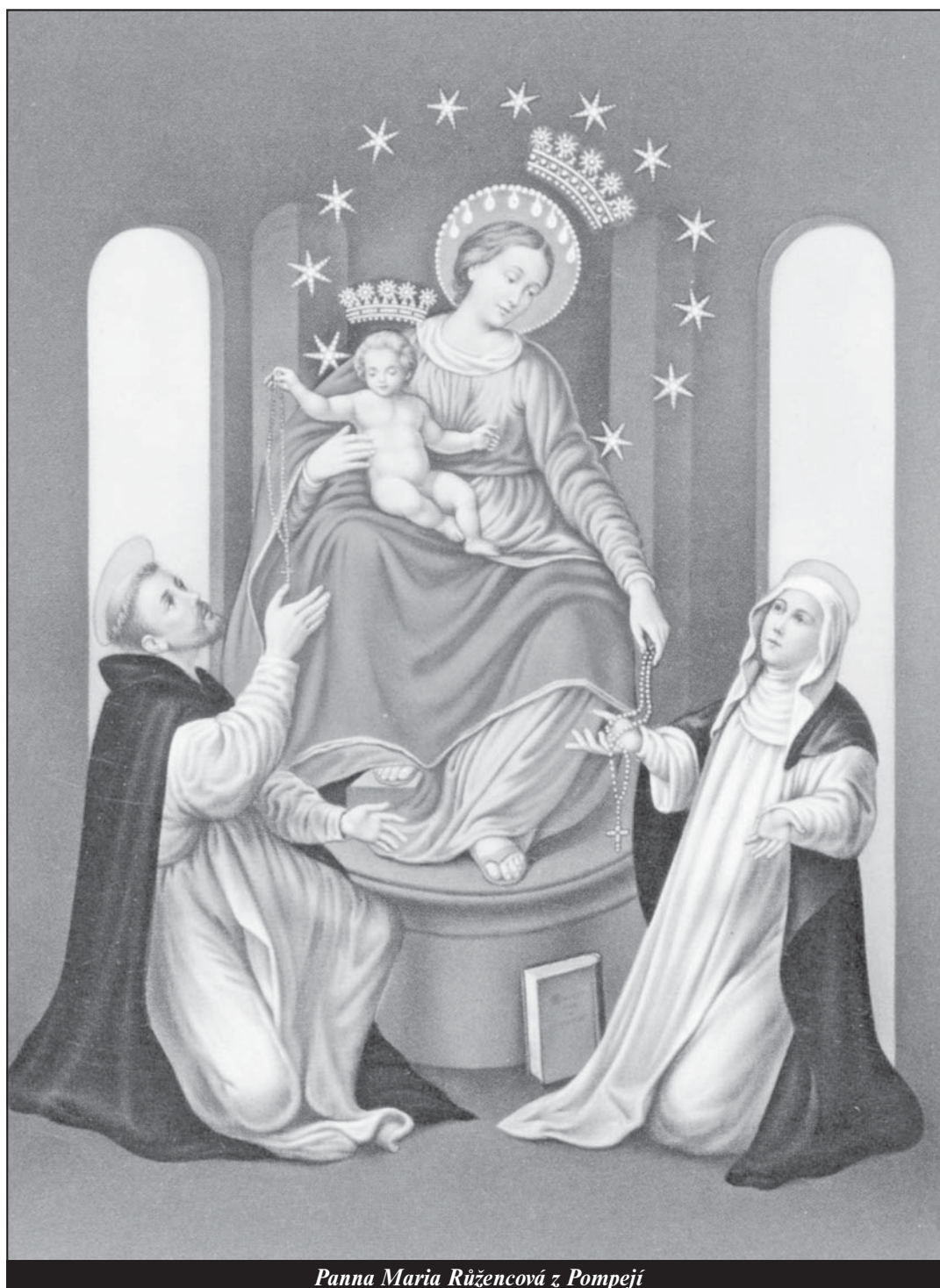
Panna Maria Růžencová z Pompejí