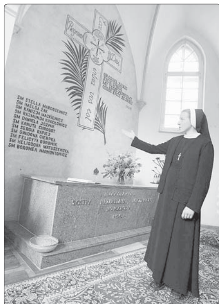
Pamětní deska v kostele Proměnění Páně v Nowogrodsku věnovaná památce bl. Marie Stelly od Nejsvětější svátosti a jejím deseti spolusestrám