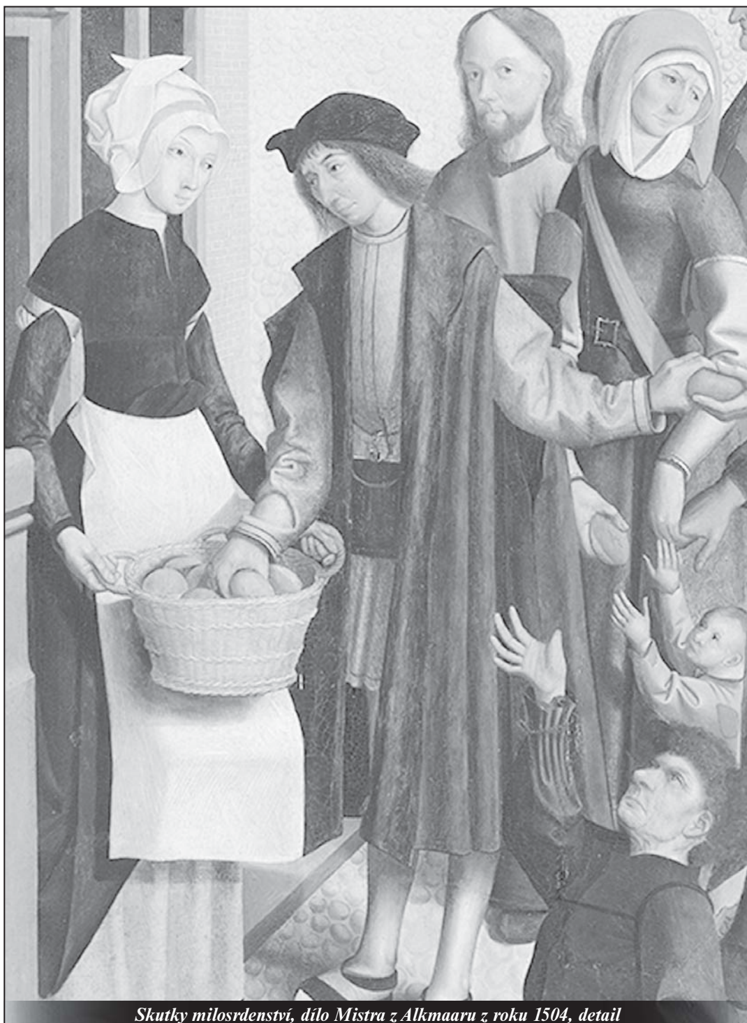
Skutky milosrdenství, dílo Mistra z Alkmaaru z roku 1504, detail