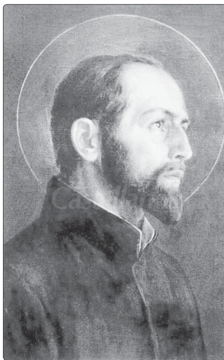
Svatý Antonín Maria Zaccaria

telnu a častokrát – i po drahých letech – také do jeho zpovědnice. O dosahu jeho činnosti si uděláme nejlépe obrázek podle titulu „otec města“, jež mu přiřkli městští radní.