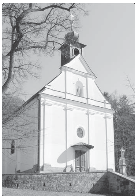
Kaple poutního místa Malenisko u Provodova