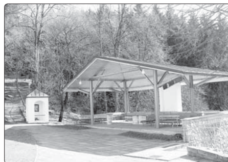
Venkovní poutní areál s kapličkou postavenou nad pramenem