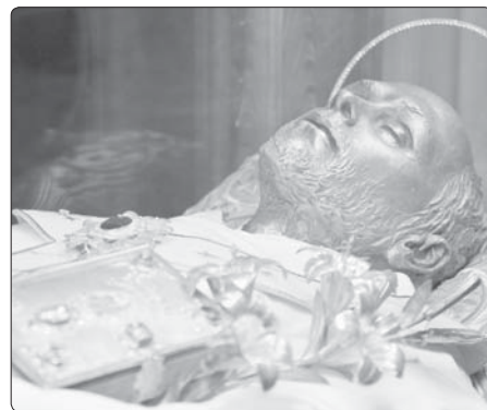
Neporušené tělo sv. Antonína Zaccarii je uchováváno v kostele sv. Barnabáše v Miláně

Ještě mu nebylo ani 37 let, řeklo by se, že byl na vrcholu sil, a svým způsobem to vrchol opravdu byl. Více jich už totiž neměl, všechny do poslední částičky rozdál při všech těch cestách ke ztraceným ovčím Říma, k nemocným či sněti luterského bludu zasaženým údům Kristovým, při všech těch kázáních, katechezích a bezesných nocích strávených před svatostánkem. Do krajnosti vyčerpán se zmožil už jen na prosbu, aby byl převezzen do rodné Cremony. V tomto městě, v němž na svět přišel, ze světa i odešel, vyprovázen na cestě do nebeského domova objetím své matky. Bylo 5. července 1539.