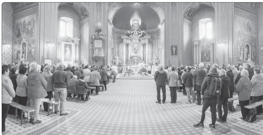
Pouť Matic na Svatém Hostýně