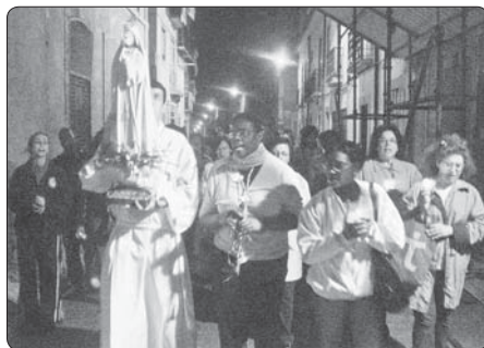
Panna Maria Fatimská ve vykřičené čtvrti Lisabonu