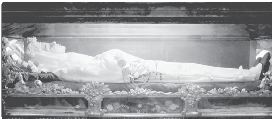
Ostatky bl. Imeldy ve farním kostele sv. Zikmunda v Boloni

Sestry byly do hloubi duše zasaženy tímto výjevem a zároveň i šťastné. Měly