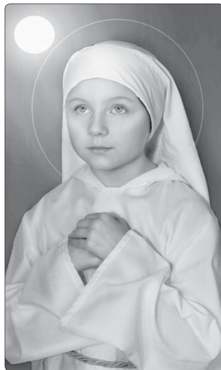
Bl. Imelda Lambertiniová

la klečet v chórové lavici. Ve své bezmoci a touze se otrásala tichým pláčem z pocitu nenasycení Kristem Ježíšem a se staže-