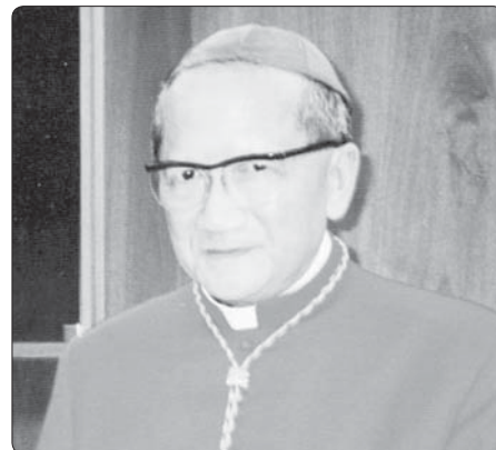
Kardinál F. X. Van Thuân

François Xavier Van Thuân (1928–2002) byl jen tři měsíce biskupem v Saigonu (Vietnam), když se 15. srpna 1975 z ničeho nic stal vězněm. Avšak jedné noci uprostřed izolace a drsné skutečnosti ve své cele François pochopil: „Ještě jsi stále bohatý. Máš ve svém srdci Kristovu lásku. Miluj všechny tak, jako je miluje Ježíš. “ A Ježíši slíbil: „Budu tě následovat ve tvém umučení a zmrtychvstání. “ Tak se přijatý kříž stal pro Van Thuâna mocným klíčem v jeho ruce, který mu tak ve vlastním srdci, jakož i v srdcích jeho přátel i nepřátel zpřístupnil nově nečekané milosti.