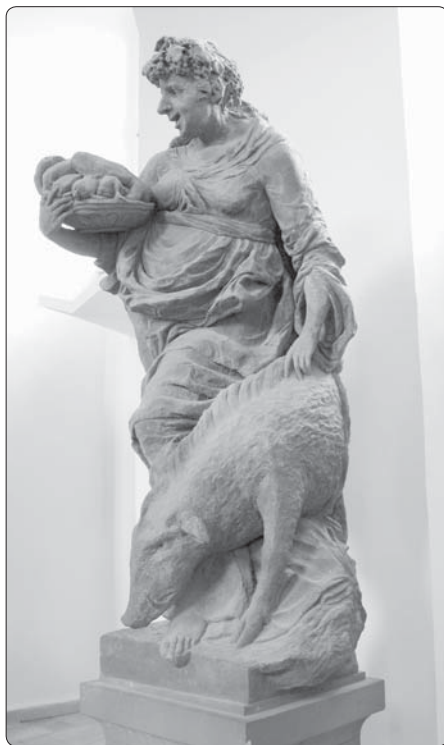
Matyáš Bernard Braun (1684–1738): Obžerství

hostinu, je nutno se držet zpátky od jídla v tomto životě a tím si zajistíš hostinu mnohem lepší. Stejně tak to vidíme v tomto světě, když je někdo pozván na významnou hostinu, před kterou se v polehce odřekne svého oběda, aby si večer užil všech lahůdek a nic mu tak neušlo.