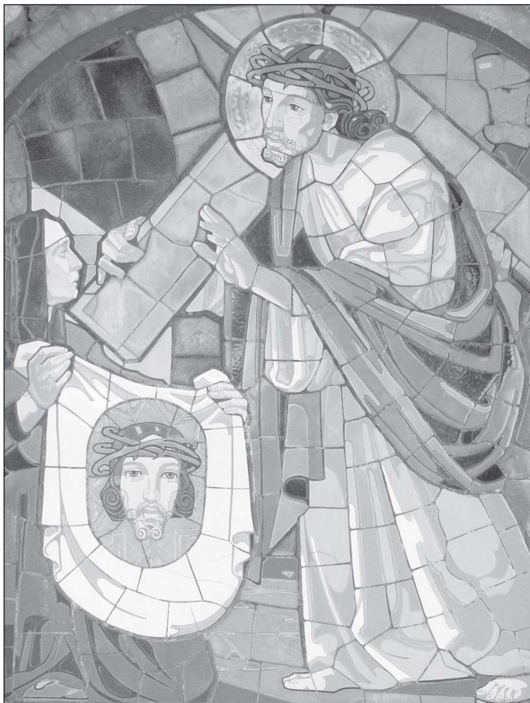
Jurkovičova křížová cesta na Svatém Hostýně, detail mozaiky Jano Köhlera

Tajemství zjevení v Tre Fontane (50) Saverio Gaeta - strana 13 -