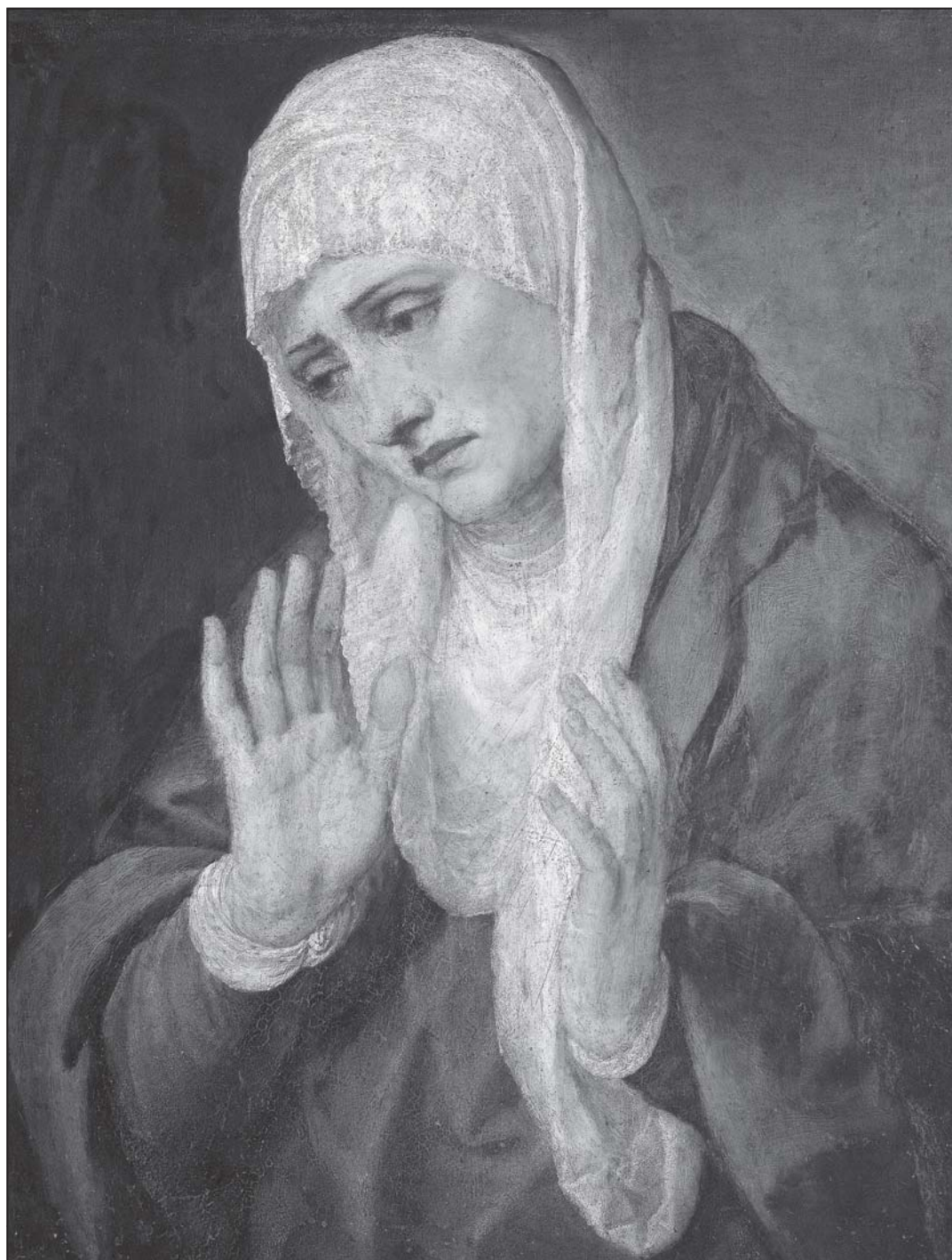
Tiziano Vecellio (1488-1576): Mater Dolorosa

Nejvyšší soud potvrdil propuštění Asie Bibi - strana 13 -