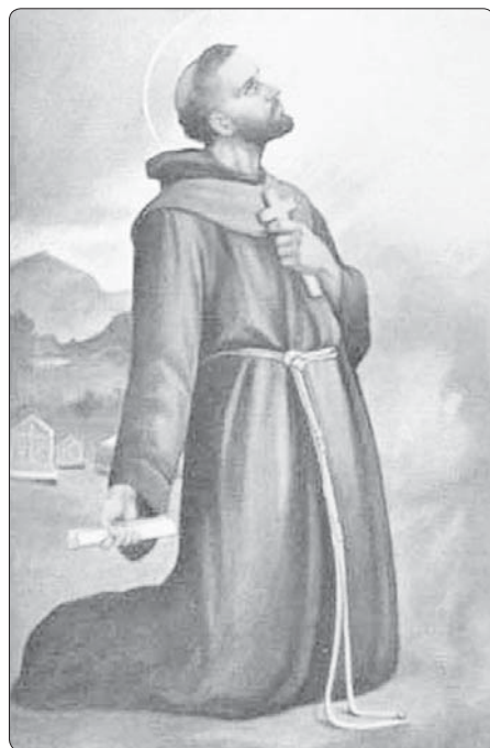
Svatý Mikuláš Tavelić

Původně tak chtěli učinit v jeruzalémské Omarově mešitě, stejně jako kdysi sv. František před sultánem, ale ve vstupu dovnitř jim bylo zabráněno. Muslimové právě slavili jeden ze svých největších svátků – Kurban Bayram (Svátek oběti) a vstup „džaurů“ do mešity se jim jevil jako znesvěcení posvátného místa. Namís-