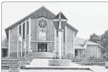
Mariánská poutní svatyně na místě zjevení, Kibeho