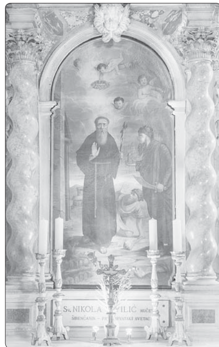
Boční oltář zasvěcený sv. Mikuláši Tavelićovi v chrámu sv. Františka v dalmatském Šibeniku

to kázání byli předvedeni před kádiho, tj. islámského soudce, jemuž podléhají všechny náboženské i občanské záležitosti muslimů. Misionářům to nikterak neubralo na odhodlání, islám ve své připravené řeči označili za falešnou nauku, pro Mohameda neměli dobrého slova a vyzvali všechny přítomné k obrácení a přijetí víry v Krista, který za lidi zemřel na kříži. Kádi byl obsahem řeči čtyř františkánů úplně ohromen – nikdo se až dosud neodvážil takto hanit Proroka na těchto místech. Zcela konsternován se jich zeptal: