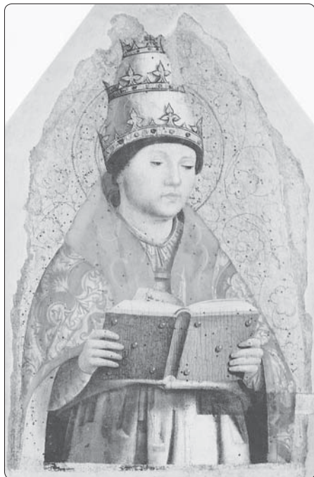
Svatý papež Řehoř Veliký

Člověk bezúhonný, poctivý a bohobojný se varuje zlého. Každý, kdo směřuje k věčné vlasti, žije nepochybně jako člověk bezúhonný a poctivý. Bezúhonný v jednání, poctivý ve víře; bezúhonný v pozemském