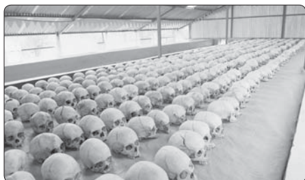
Památník genocidy, Kibeho

my ve Rwandě jsme nebyli ochotni obrátit se, a tak jsme viděli následky – válku, genocidu.“ Desetitisíce zmasakrovaných těl pachatelé poházeli do řek, zvláště do řeky Kagera, která je odnášela do sousedních zemí, do Tanzánie a Ugandy. To všechno ohrožovalo zdraví obyvatel těchto zemí.