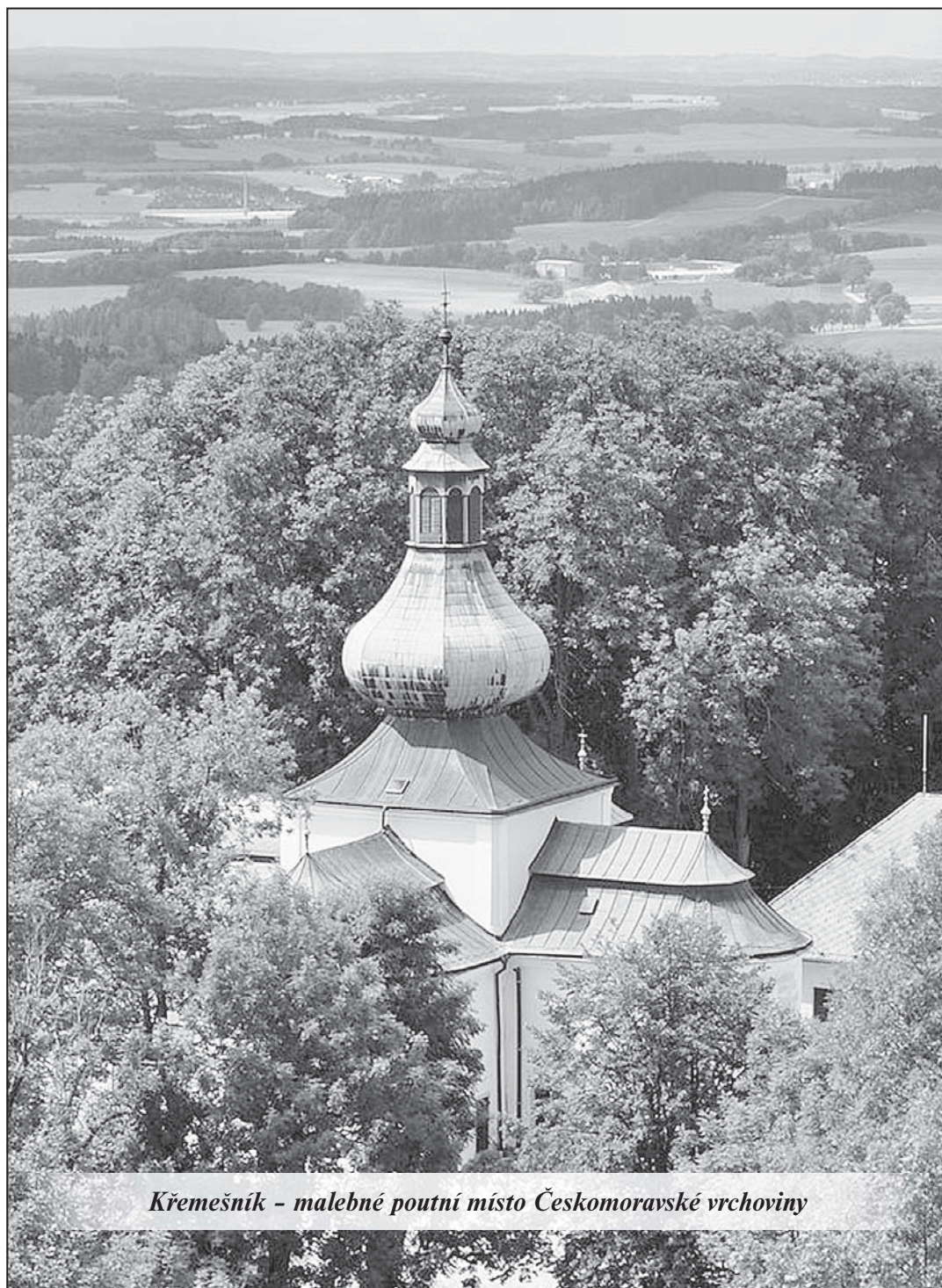
Křemešník - malebné poutní místo Českomoravské vrchoviny