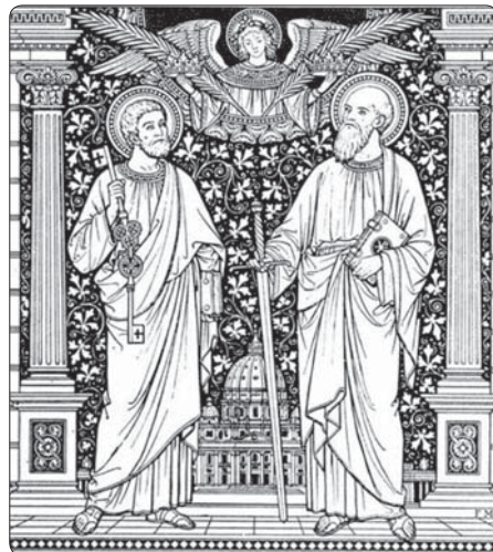
Svatí apoštolové Petr a Pavel

A Římanům se rozezpívá jako vášnivě milující Toho, který se ho dříve zmocnil: „Kdo nás odloučí od Kristovy lásky? Soužení, úzkost, pronásledování, hlad, nahota, nebezpečí, meč? ... Ani andělé, ani knížata, ani přítomnost, ani budoucnost, ani mocnost, ani výšina, ani hlubina, ani žádné jiné stvoření nás nedokáže