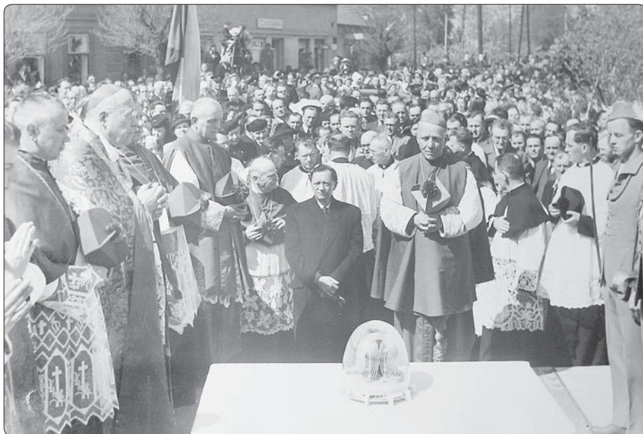
V Libici nad Cidlinou 24. 4. 1947 – uctění lebky sv. Vojtěcha

Jak je z výše uvedeného příkladu patrné, Msgr. Josef Beran nepouštěl ze zřetel veřejný politický život. Ač byl sám do roku 1948 lidovec, důsledně trval na oddělení Československé strany lidové jako politické základny československých katolíků od katolické církve, jež je institucí spásy. Samozřejmě podporoval snahy katolíků sdružených v ČSL, ale odmítal aktivity některých jejích straníků, kteří si osobovali právo vystupovat jménem církve. Zde hovořila biskupská autorita, jasně hájila nezávislost církve na politické straně a jakékoliv společnosti založené lidmi. V otázce komunismu se pohyboval v jasných mezích církevní nauky. S vděčností uznal sovětské oběti přinesené pro československou samostatnost. S mnoha komunisty jej pojilo osobní přátelství z válečných dob v koncentráku. Avšak komunismus jako programově protináboženskou doktrínu nikdy nemohl akceptovat. Proto jakoukoliv možnost spolupráce s KSČ odmítal pro nesluči-