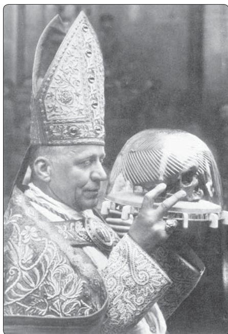
Msgr. Josef Beran s lebkou sv. Vojtěcha

Během svých cest nevynechával ani Slovensko, kde hledal cesty ke sbratření se slovenskými katolíky. Od roku 1918 se prohlubovaly názorové rozdíly mezi českými a slovenskými katolíky, zejména v politické rovině. Vztahy se komplikovaly kvůli odlišnému pohledu na existenci a charakter první Československé republiky a sporu o autonomii Slovenské krajiny. Na vzájemnost obou národů mělo negativní dopad odsouzení bývalého prezidenta Slovenské republiky Josefa Tisa k trestu smrti v dubnu 1947. V Tisův prospěch intervenovali na Slovensku tamní katoličtí biskupové i představitelé evangeliků. Josef Beran si byl vědom, že