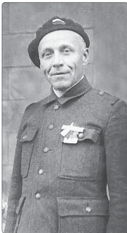
Osvobozený politický vězeň P. Josef Beran v roce 1945

Sám onemocněl břišním tyfem, po návratu z táborové nemocnice vážil pouhých 49 kg. Opět zařadila muklovská solidarita a Beran – přezdívaný Jozífek – se dostal do komanda k invalidům, kde spravoval oblečení a vyhnul se fyzické dřině. Když opět nabyl zdraví a byl schopen běžného koncentračnického života, učinil slib, že jestli se vrátí domů, nikomu neodepře žádnou prosbu, pokud nebude odporovat Boží vůli. V bídných poměrech přijímal často podporu svého okolí a toužil odvděčit se za přijatá dobrodíní. Ještě v lágru uskutečnil hodně ze svého předsevzetí. Když obdržel velký balíček s potravinami, skoro všechno rozdal. Obecně se vědělo, že kněží dostávají větší balíčky, neboť na ně pamatovala jejich rodina