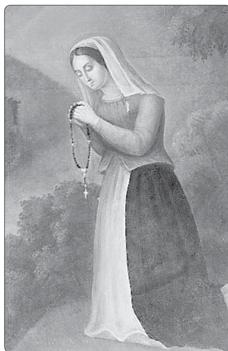
Svatá Germána Cousinová

Ráno tři kněží nezávisle na sobě vyprávěli vesničanům o svých nočních vizích, které neskončily jedním obrazem. Dále totiž pozorovali, jak zástup panen