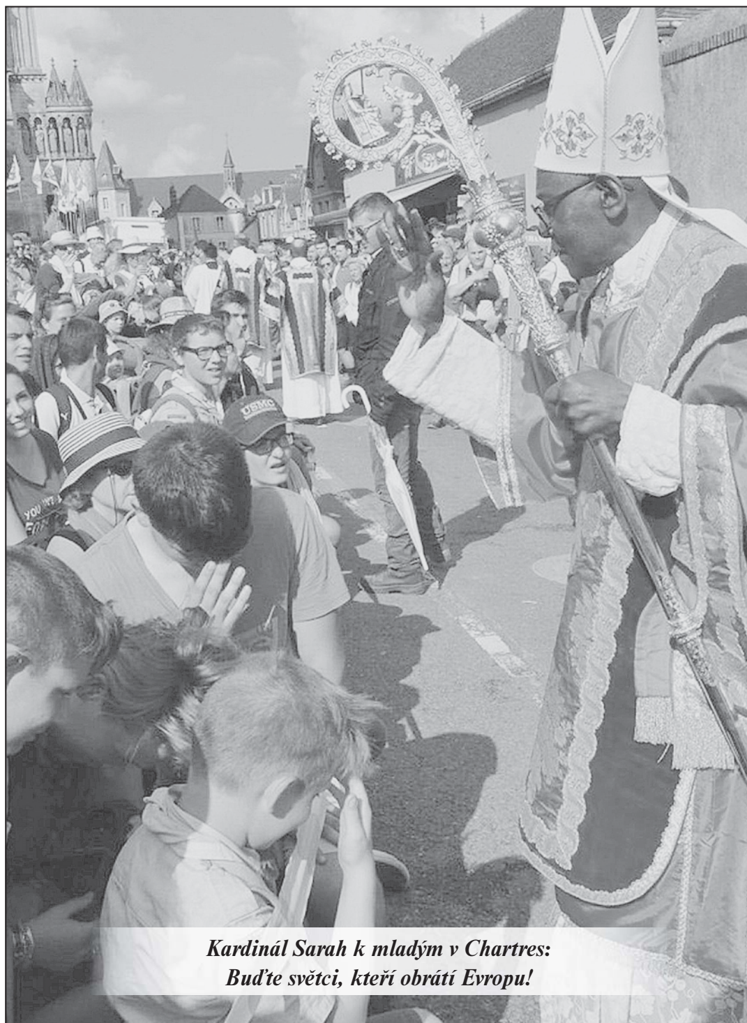
Kardinál Sarah k mladým v Chartres: Buďte světci, kteří obrátí Evropu!

Flexibilní formy práce: benefit, který nutí k větším výkonům - strana 13 -