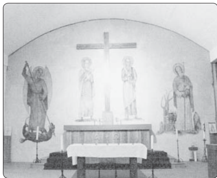
Táborová kaple semináře za ostatními dráty v Chartres (foto z r. 2005)