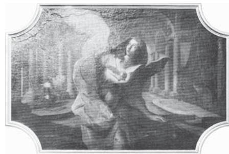
Duch bázně Boží

Krátká věta ze Summy Theologiae řeší zdánlivý rozpor mezi láskou a bázni: „Každá bázeň vyplývá z lásky; protože kdo se bojí, bojí se jenom protikladu toho, co miluje.“ Bázeň není jenom protikladem lásky, bázeň je spíše možná pro někoho, kdo upřímně miluje. Protože láska se bojí toho, aby nebyla oddělena od milovaného. Proto musí (!) dokonce každý, kdo upřímně miluje, být doprovázen bázni, že ztratí tuto lásku. Ne z otročké bázně před trestem, nýbrž bázní, že zarmoutí milovaného, že zraní svoji lásku. Tímto způsobem nebude bázeň Boží nikdy překonána láskou. Je sice pravda, že o co je větší láska, o to menší je strach z trestu; ale stejně tak