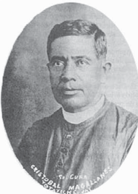
Svatý Kryštof Magallanes Jara

Tento svobodný zednář a ultralevicový politik se s oblibou tituloval jako „osobní nepřítel Boha“ či „antikrist“. Zahraniční misionáři a kněží byli na základě jeho rozhodnutí vyhnáni ze země, „osobní nepřítel Boha“ dále rozpustil řehole, církev