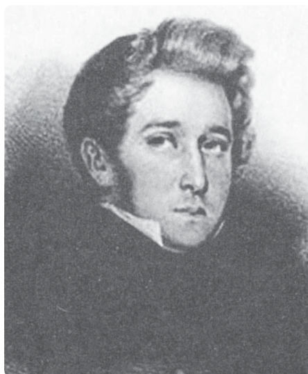
Adolf Dechamps (1807–1875)