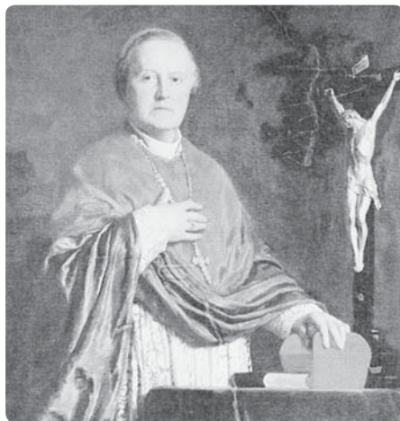
Belgický kardinál Viktor Dechamps (1810–1883)

Při zpáteční cestě domů zamířili tito tři poutníci do La Saletty v Alpách; zde se přece zjevila v roce 1846 Matka Boží a hořce plakala! Luisa, která se stále zabývala svým problémem povolání, se začala modlit farářem doporučenou nověnu. Devátého dne měla absolutní jasno: Vstoupí do řádu Srdce Ježíšova Matky Baratové.