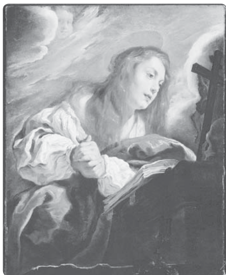
Pokání Marie Magdalény

„Když byl Jan vydán, přišel Ježíš do Galileje, hlásal Boží evangelium a říkal: »Čas se naplnil a Boží království je velmi blízko; číňte pokání a věřte evangelium.«“ (Mk 1,14–15)