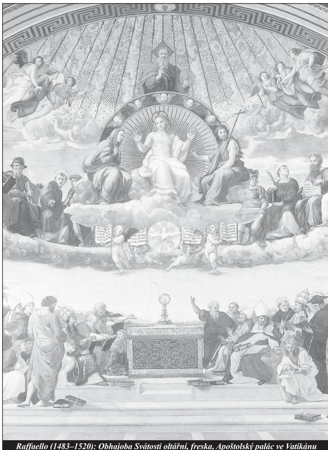
Raffaello (1483–1520): Obhajoba Svátosti oltární, freska, Apoštolský palác ve Vatikánu

Ani oko nevidělo... (16) F. J. Boudreaux SJ - strana 12 -