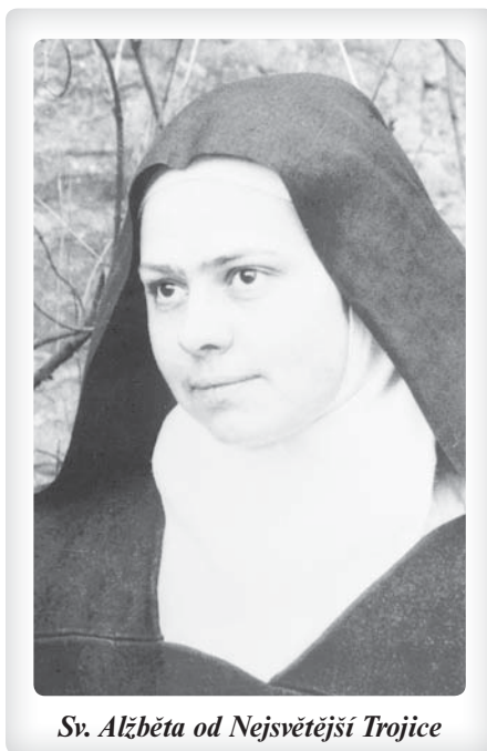
Sv. Alžběta od Nejsvětější Trojice

Tím druhým je mladý člověk. Nežil sice v naší době, ale jakoby v naší době, obklopen všemožnými smyslovými dráždidly. V 16. století bylo těžké, aby jako mladý muž žil život, který by se líbil Bohu. Zvláště v jeho postavení: jako šlechtické páže na dvoře knížete Medicejského v Brescii. Všichni jeho přátelé – ba dokonce jeho otec, markrabě z Castiglione – ho povzbuzovali, aby žil tak jako všichni a hověl všem pudům, které má mladý muž.