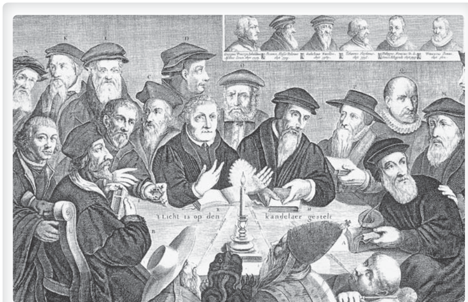
Představitelé reformace u společného stolu, anonymní rytina ze 17. století

K definitivnímu odmítnutí katolického učení o svátostech, tedy i svátosti manželství, došlo u Luthera v roce 1520 v traktátu De captivitate Babylonica (O otroctví babylonském). Ve stejném textu tvůrce reformace nejenom vypověděl poslušnost papeži a biskupům, ale také odmítl učení církve od apoštolských dob, že manželství jako svátost je příčinou a ne