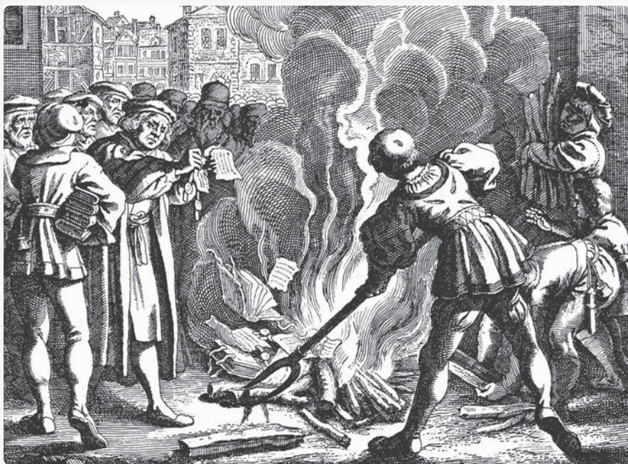
Definitivní rozchod Martina Luthera s katolickou církví se odehrál ve chvíli, kdy spálil papežskou bulu, která ho exkomunikovala.