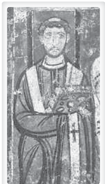
Papež Lev IV., detail fresky z 9. stol., bazilika sv. Klementa v Římě