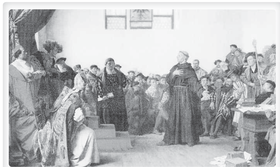
Martin Luther před sněmem ve Wormsu (autorem obrazu je Anton von Werner)

Martin Luther byl autorem prvního německého překladu Bible (překladatelskou práci skončil v roce 1534). Právem se tím zdůrazňuje jeho zásluha pro kulturu a německý jazyk. Ale v žádném případě to překladatelské dílo nebylo dokladem rozvoje německé (protestantské) teologie. Protestantská Bible totiž nemá stejný význam jako katolické Písmo svaté. Především proto, že v průběhu jejího překládání Martin Luther tak změnil text