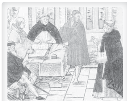
Martin Luther (vpravo) před kardinálem Kajetánem (vlevo, s knihou)

Zůstaneme-li u Kalvína, nutno vzít v úvahu, že křesťanská vize Boha, tak silně zdůrazňovaná papežem Benediktem XVI., spojující chápání milosrdného Otce s Bohem – Logem, se nesrovnává nejenom s voluntaristickou vizí obsaženou v islámu, ale rovněž s kalvínskou teorií predestinace. Ta hlásá, že podle moci tajemného, ale rovněž naprosto arbitrálního výběru, jsou vůlí Boha někteří lidé od počátku svého života predestinováni (předurčeni) ke spáse, a jiní k zavržení. Bez ohledu na život, jaký vedli, jaké konalí skutky, jakou smrtí zemřeli. V Institucích křesťanské nauky Kalvín s charakteristickou systematičností zdůrazňuje „Boží vůli“. Píše: „Poněvadž ne všem lidem se stejným způsobem hlásá Smlouva života, a dokonce u těch, kterým se hlásá, nachází různé přijetí, to právě v té rozdílnosti se