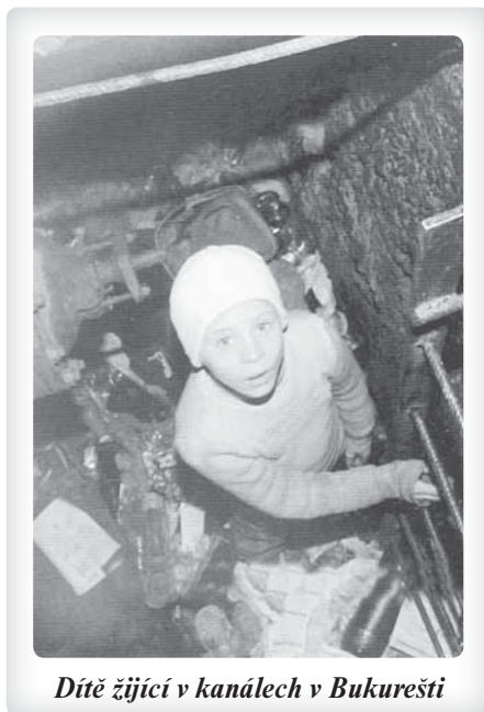
Dítě žijící v kanálech v Bukurešti

Následovaly měsíce hledání. Ačkoli jsem navenek i nadále vedl svůj obvyklý život obchodníka, chodil jsem čtyřikrát týdně večer na liturgii hodin do Opatství sv. Pavla v městě Oosterhout, abych znovu objevil své kořeny. V únoru 1993, bylo to na Popeleční středu, jsem si dopřál celý den ticha a modlitby, abych mohl v klidu rozmýšlet nad svým živo-