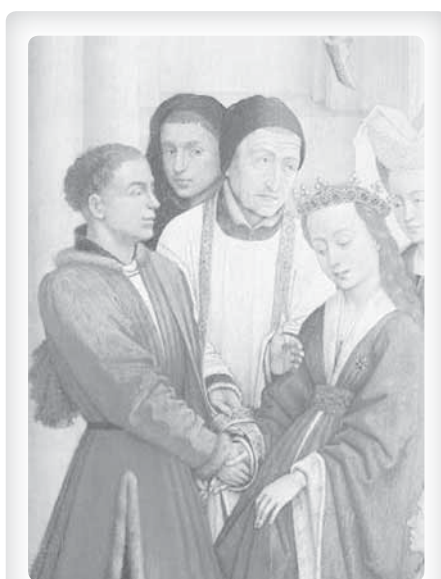
Rogier van der Weyden (1400-1464): Sedm svátostí, detail - svátost manželství

Rodiče dávají fyzicky život novému dítěti, ale neponechávají si je, nýbrž hned své dítě přinášejí církvi, přinášejí ke Kris-