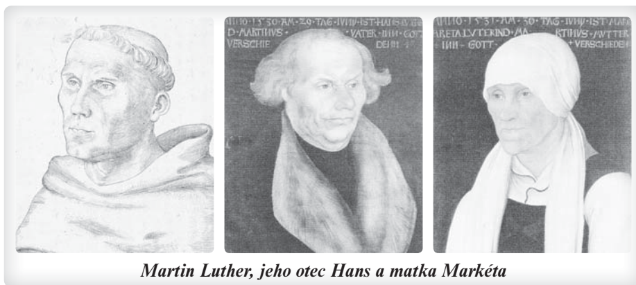
Martin Luther, jeho otec Hans a matka Markéta

Luther nepochybně toužil po svatosti, kterou ztotožňoval – uvedme zde ještě jednou J. Maritaina – spíše s „citovou útěchou“. „Lutherovi šlo o to, aby se cítil ve stavu přízně – jako by milost sama o sobě byla předmětem citového prožívání. (...) Prudká mystická touha v neklidné duši, zkrslující všechna doporučení mystiků, se měnila v brutální potřebu opájet se svou vlastní svatostí.“