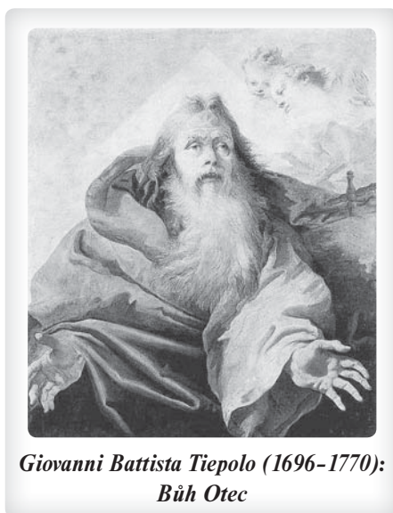
Giovanni Battista Tiepolo (1696–1770): Bůh Otec

odvodit, že Bůh, jako takový, ke své existenci nepotřebuje nic ze stvořených věcí, a to ani člověka. Bůh bude stále Bohem. Vraťme se však k myšlence ze začátku naší úvahy. Bůh je nám Otcem po Božím způsobu. Podle slov papeže Františka by se dalo toto Boží otcovství chápat tak, že Bůh by bez člověka nemohl být nazýván Otcem. Bude vždy Bohem, i bez člověka, ale ne Otcem. Už z toho důvodu, že pojem „otec“ vyjadřuje určitý vztah, kdežto Bůh je, jak už napsáno, věčný. (4)