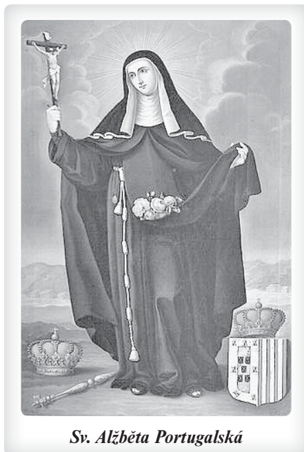
Sv. Alžběta Portugalská

Musela též čelit falešnému nařčení z nevěry. Jedno z jejích pážat žárlilo na svého druha, který se pro svou zbožnost těšil Alžbětině přízni. Nařklo tedy svou paní z cizoložného poměru právě s oním jejím mladým oblíbencem. Král nechtěl z pochopitelných důvodů dělat z aféry veřejnou záležitost, smluvil se proto se správcem vápenky, jemuž důvěřoval, aby údajného viníka upálil ve vápenné peci. Poznávacím znamením měla být otázka dotyčného, zda králův rozkaz byl vykonán. Ráno pak vyslal mladíka, jehož se chtěl zbavit, ke správci vápenky, leč zbožné páže zlákal zpěv z útrobu chrámu, v němž zrovna probíhala mše. Vešlo do chrámu, kde se do liturgie ponořilo tak, že zapomnělo na okolní svět. Ne však ono úskočné páže. To chtělo mít jistotu, a proto se šlo osobně zeptat do vápenky jejího správce, zda byl králův rozkaz vykonán... Šokovaný král spatřil v takovémto vyústění celé kauzy nejen důkaz manželčiny nevinny, ale i varovný prst Boží. Načas šel proto do sebe. Ne nadlouho.