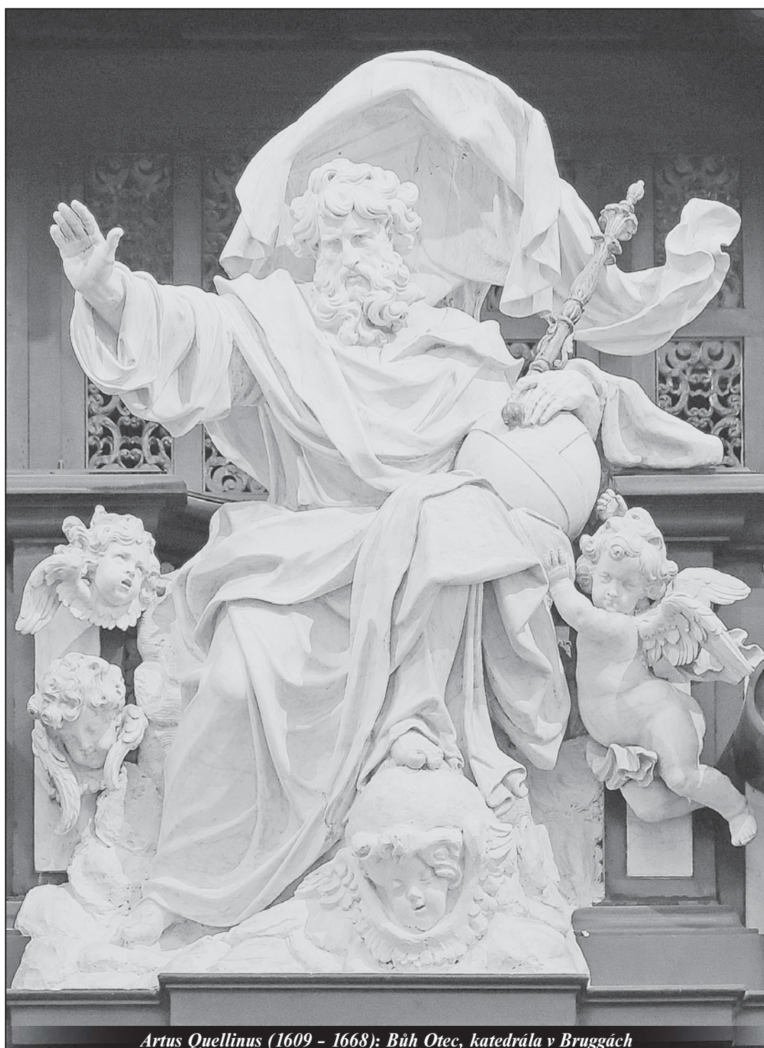
Artus Quellinus (1609 - 1668): Bůh Otec, katedrála v Bruggách