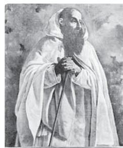
THEOBALDIS EREMITA CAMALINI

Pověst svatosti jej dohnala i v této severoitalské oblasti. Theobaldovo jméno přilákalo do těchto končin brzy hojné následovníky a kolem zbožného askety se vytvořila nejprve menší, poté stále více se rozrůstající komunita, která toužila po jeho vzoru naplnit své dny modlitbou, rozjímáním a služebnou prací. Jeho věhlas lákal do Salaniga i četné zástupy zvědavců a jednoho dne se mezi příšedšími objevili