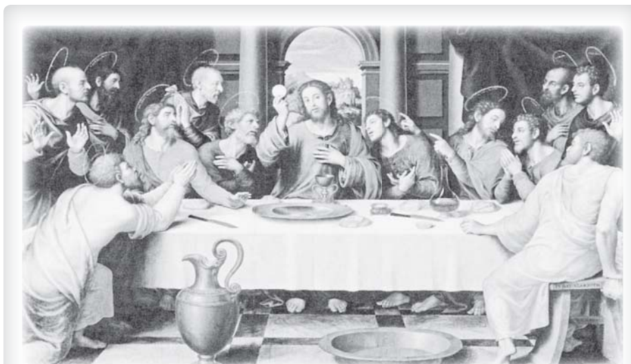
Vicente Juan Masip: Poslední večeře Páně, Prado Museum, Madrid

Také zemřelí mají užitek ze mše svaté, když je sloužena za zemřelé, kteří jsou v očistci. Ona působí, že „tomuto ohni vystavené duše jsou po dobu jejího trvání uchráněny svého utrpení,“ říká svatý Jeroným. A dodává k tomu: „Mnoho du-