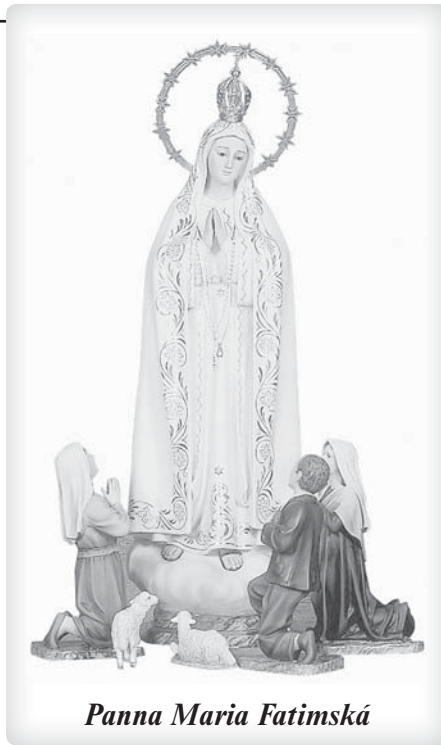
Panna Maria Fatimská

Maria těmito slovy slíbila spásu všem těm, kteří alespoň jednou v životě oslaví tímto způsobem daným z Fatimy pět prv-