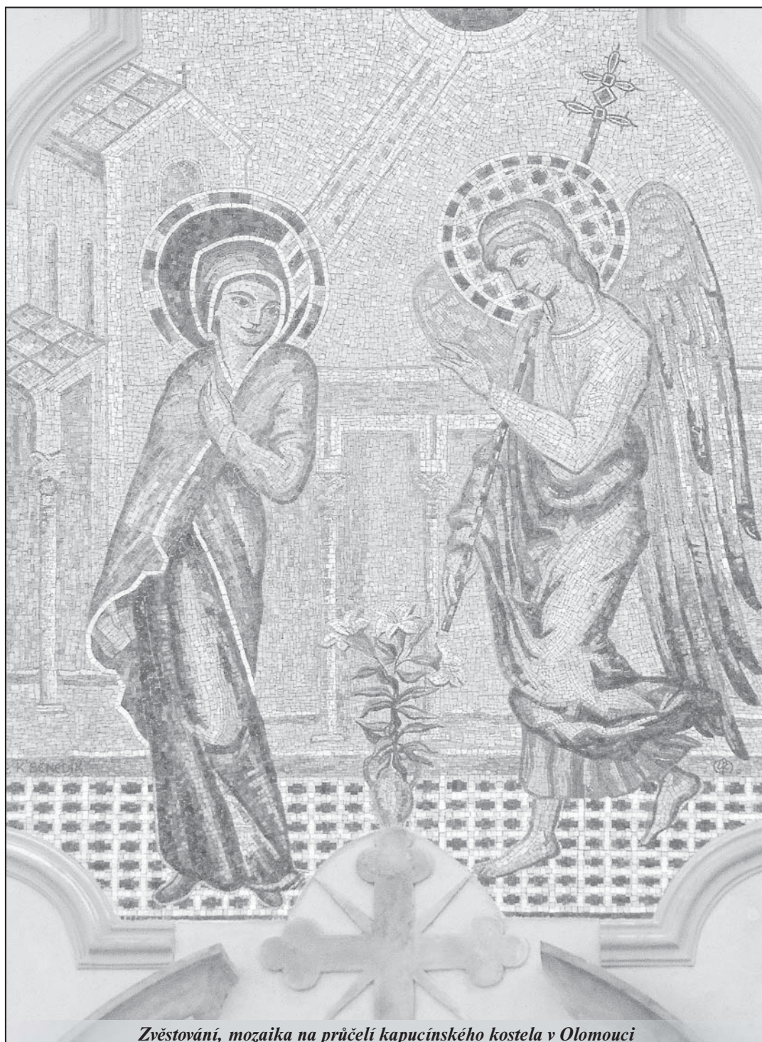
Zvěstování, mozaika na průčelí kapucínského kostela v Olomouci