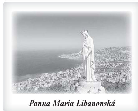
Panna Maria Libanonská

pod sochou sv. Eliáše, čili ještě blíže k nim, muži se s nimi nemodlili. Znovu upozornili policisty. Když se blížili, chtěli se mladíci odpálit, avšak spouštěče jim opět nefungovaly. Policie je odvedla a nikomu z lidí se nic nestalo.