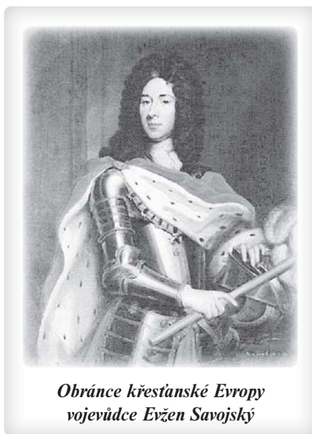
Obránce křesťanské Evropy vojevůdce Evžen Savojský

Francouzi roku 1708 předešli Evžena a sami zaútočili na říši. On je s anglickou pomocí přemohl v bitvě u belgického Oudenaarde u břehů Šeldy. Mírová jednání s Francouzi v Haagu byla bezvýsledná. Další tři roky se bojovalo. Francouzi se uvolnili ze sevření koalice až po nástupu toryů v Anglii a úmrtí císaře Josefa I. roku 1711. Protifrancouzská koalice se rozpadla. Evženovi připadl nelehký úkol hájit jako vrchní velitel západní hranici říše