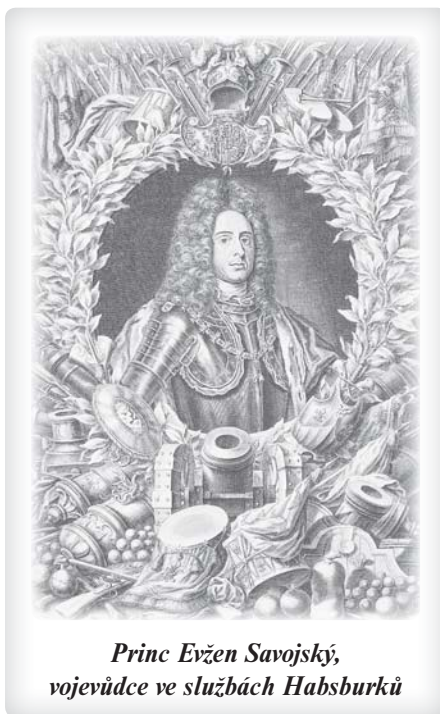
Princ Evžen Savojský, vojevůdce ve službách Habsburků

Po Vídni 1683 byla Turkům zasazena další tvrdá rána v bitvě u Zenty 11. září 1697 v srbské Vojvodině u řeky Tisy. Maršál Evžen Savojský je zde drtivě porazil. Jeho armádě se podařilo překvapit Turky při přechodu řeky Tisy. Odhadem padlo na 20 000 Turků a dalších 10 000 utonulo v řece. Příčinou střetnutí byla snaha tureckého sultána Mustafy II. získat zpět území v Uhrách a Sedmihradsku, ztracená v důsledku