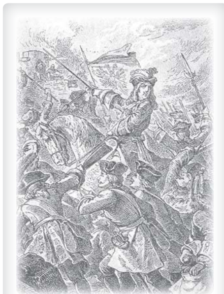
Evžen Savojský, hrdina od Zenty

Dalším triumfem nezdolného savojského prince bylo vítězství habsburských zbraní proti Francouzům v bitvě u Turína 7. září 1706, v níž podlehl francouzský velitel, generál Ferdinand de Marsin. Současně na francouzsko-říšských hranicích vedl úspěšnou kampaň proti Francouzům také vévoda z Marlborough. Díky soustředěnému tlaku v roce 1707 Francouzi italské bojiště vyklidili. Evžen se v tuto dobu stal říšským maršálem a z pozice guvernéra spravoval Lombardii mezi lety 1707 až 1716. Ruský car Petr Veliký věhlasnému vojevůdci nabídl polskou korunu, o níž