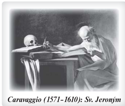
Caravaggio (1571-1610): Sv. Jeroným

Zvláště v umění barokní doby nacházel tento verš z knihy Kazatel (1,2) velký ohlas. Básníci opěvovali ve chmurných tónech nicotu světa a jeho krásy, pomíjivost lidského života a snažení s jeho radostmi a strastmi (protože ve smyslu „nicotnost a pomíjivost“ se původně myslelo slovo „marnost“).