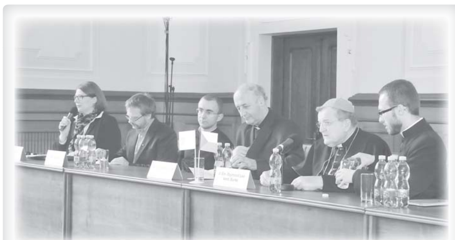
Konference Nejmenší z nás, které se v Brně 13. října 2016 spolu s olomouckým arcibiskupem Mons. Janem Graubnerem účastnil vzácný host kardinál Raymond Burke