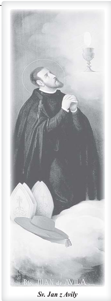
Sv. Jan z Avily

Bůh Vám dává tato utrpení zde, aby Vás jich ušetřil na věčnosti. Říká o své vinici: „Aby jí nikdo nedělal nic zlého, střežím ji ve dne v noci.“ (Iz 27,3) Nedo- volí, aby jí slunce ve dne ublížilo, ani měsíc v noci: Ať už nás utěšuje, nebo trápí, upírá svůj svatý pohled na nás a nikdy ne- tak nevěrně, jako když si myslíme, že nás opustil. Důvěřujte v Boží úsudek, drahá sestro, a ne ve svůj vlastní, neboť On rozumí, co je pro Vás nejlepší, a zná součas- ný i budoucí stav Vaší duše. Nevýčerpejte se k smrti strachy, neboť jak říká evange- lium: „Kdo z vás může přidat k délce svého života jediný loket?“ (srov. Mt 6,27) Proč se potom spoléháte tak moc na se- be, když Vám Bůh nařizuje, abyste v Ně- ho věřila? Proč tak zápasíte v boji o svou spásu svojí vlastní cestou, zatímco Boží překypující milosrdenství nám prospěje mnohem více než námi představovaná spravedlnost, když stojíme před jeho po- sledním soudem?