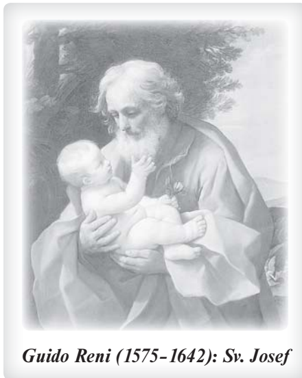
Guido Reni (1575-1642): Sv. Josef

Konečně účinek tohoto zjevení byl trojí: první vzhledem k andělovi, druhý vzhledem k Josefovi a třetí vzhledem k nejsvětější Panně. Toto zjevení tak učinilo