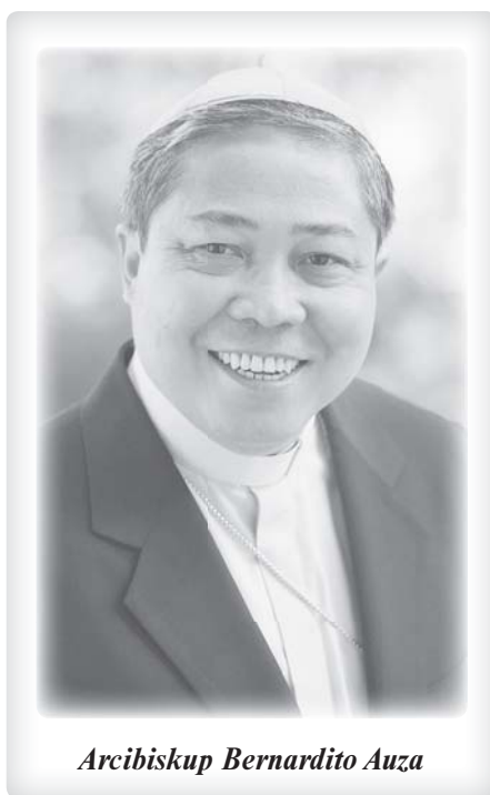
Arcibiskup Bernardito Auza

nebo přímo vyvražďováni etnické a náboženské menšiny. Stovky milionů lidí riskují život, aby utekli před pronásledováním či extrémní chudobou.