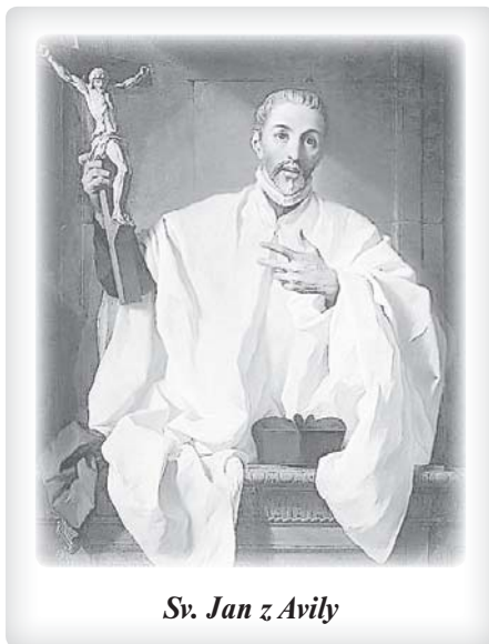
Sv. Jan z Avily

Vaše skrupule (úzkost) ohledně vzácní jsou pokušeními, kterými se ďábel pokouší připravit Vás o duchovní radosti a okrást Vás o potěšení ve věcech Božích. Skrupulózní duše nemůže zdravě důvěřovat Bohu nebo Ho milovat, a když nenalézá, co by ji v Něm uspokojilo, není spokojená s cestou, kterou ji vede, a vzdává se Ho, aby hledala štěstí jinde: Způsobuje osudovou chybu propuknutí bouře tam, kde byl klid. Následuje z domýšlivosti své vlastní nápady, a ne Boží cestu, která je vždy sladká a jednoduchá. Nakládejte se svými skrupulemi jako se žerem; poslouchejte radu svého zpovědníka; nenaslouchejte svému vlastnímu úsudku. Nesmíte připustit, aby Vás Vaše úzkosti ovlivnily, ale říkejte: „Bůh není úzkostlivý.“ Děláte to, co je mi nařizováno v jeho svatém jménu, a to je vše, na co můžete odpovědět. Nepromarněte žádný čas v získávání Boží lásky, má drahá sestro, a brzy se zbavíte svých úzkostí, které prýští z bázlivého srdce, neboť „dokonalá láska zapuzuje strach“. Volejte k našemu Pánu: „Deus meus illumina tenebras meas“ (Můj Bože, rozjasni mou temnotu) a věřte jeho milosrdné dobrotě, že zatímco Vy Mu sloužíte, On se uráčí dát Vám více milosti, abyste poznala své chyby a napрави-la je. Pokud jde o Vaše myšlenky na marnou slávu, také jim se smějte a říkejte jim: