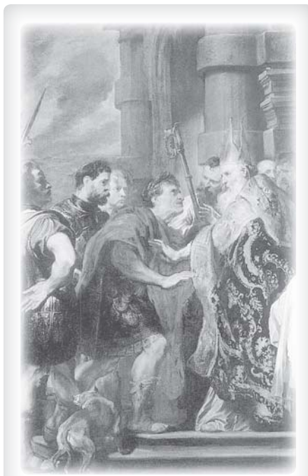
Svatý Ambrož v pontifikálním rouchu brání císaři Theodosiovi vstoupit do milánské katedrály (Anthonis van Dyck, rok 1620)

Takových příběhů bylo v historii katolické církve mnoho. Císař Jindřich IV. před hradbami Canossy; svatý Stanislav napomínající krále Boleslava Chrabrého;