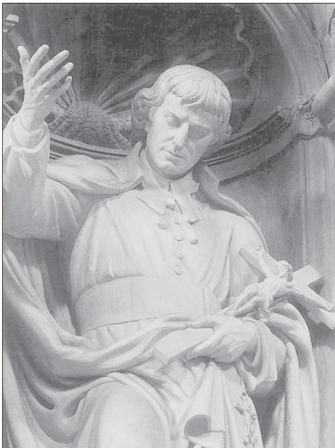
Sv. Ludvík Maria Grignion z Montfortu (31. ledna 1673 - 28. dubna 1716)

Sociálním vyloučením je ohroženo stále více občanů ČR - strana 13 -