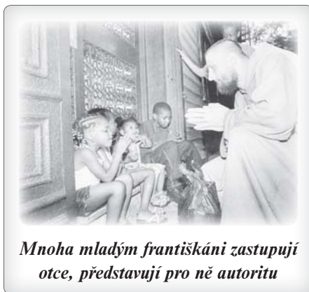
Mnoha mladým františkáni zastupují otce, představují pro ně autoritu

Bratři berou Chudáčka z Assisi jako svého duchovního otce. Po svém obrácení tento svatý odhalil, že každý člověk, a zvláště ubohý, má nekonečnou hodnotu a důstojnost, poněvadž je s ním sjednocený samotný Kristus. Proto jednoho dne políbil malomocného, kterého ces-