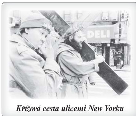
Křížová cesta ulicemi New Yorku

Nuzní vnímají jednoduchost, lásku a pokoj, které vyzařují z kláštera i z řeholníků. Bratři mají lásku, radost a pokoj, protože jsou naplněni Bohem. Stejně tak přiznávají i sami řeholníci, že je nezřídka posiluje víra lidí, kterým slouží: „Znal jsem uklízečku, která pracova-